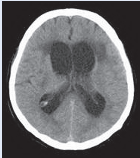
Slika 2. CT slika: Hidrocefalus s hipertenzivnom komponentom