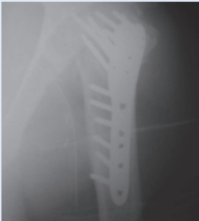
Slika 5. Stanje po osteosintezi Figure 5. Situation after osteosynthesis

ja žile. Vaskularne ozljede mogu biti povezane s ozljedama živaca čija incidencija varira od 27 do 44 % 8 . Pri svakoj glenohumeralnoj luksaciji neophodna je kontrola neurovaskularnog statusa ruke prije i poslije repozicije. S obzirom na kolateralnu cirkulaciju moguće je, kao i u ovom slučaju, ne verificirati odmah ozljedu aksilarne arterije.