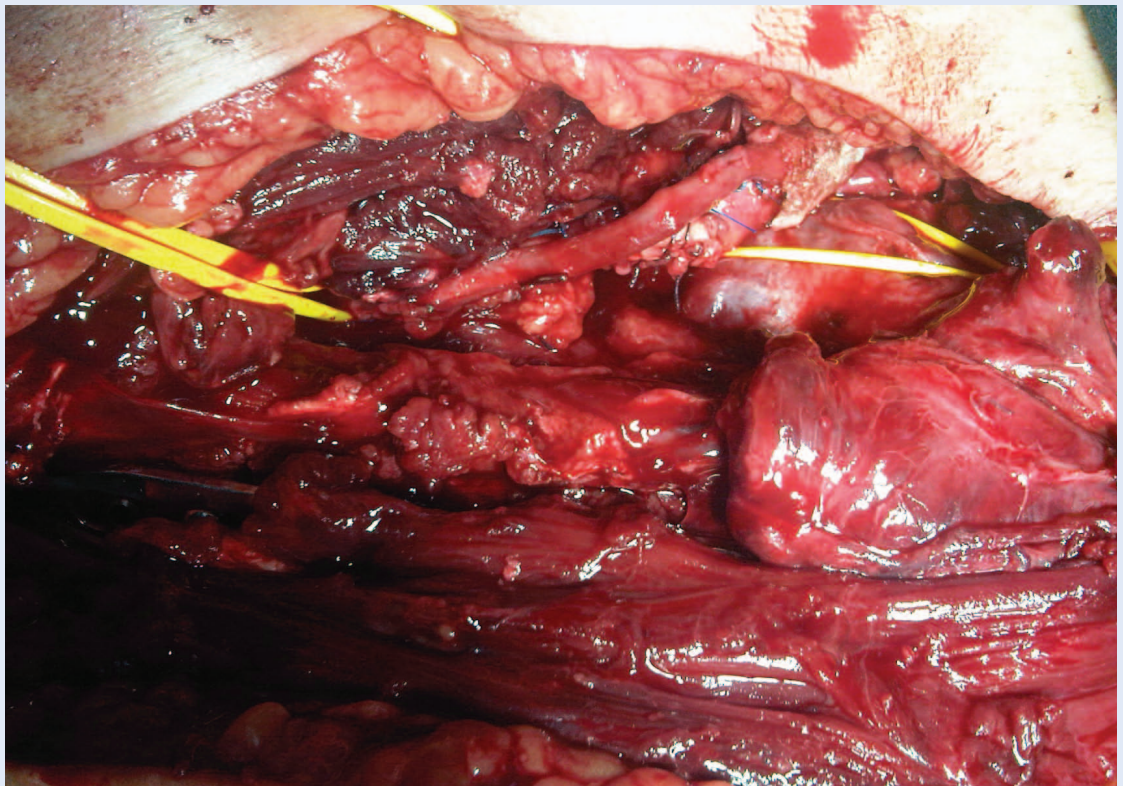
Slika 4. Rekonstrukcija s graftom v. saphene magne Figure 4. Reconstruction with v. saphena magna graft