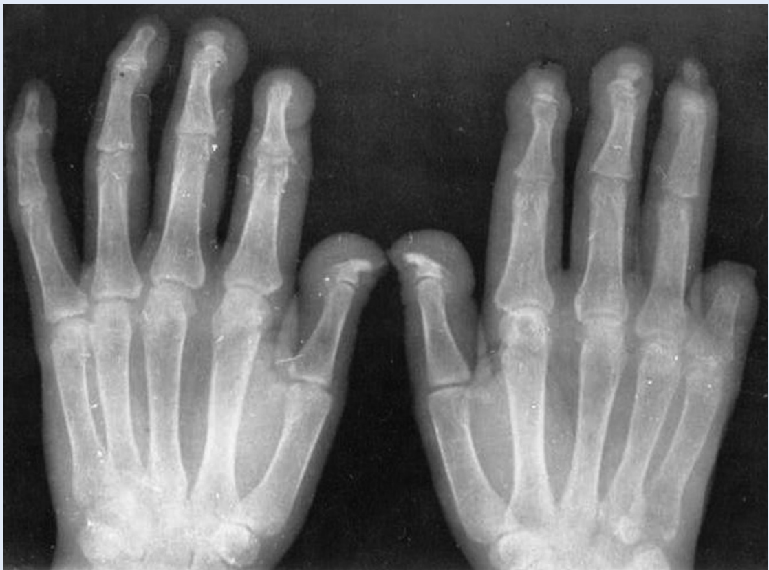
Slika 1. Sekundarni hiperparatireoidizam, reapsorpcija distalnih falangi Figure 1. Secondary hyperparathyroidism, reabsorption of the distal phalanx

Najčešći simptomi su: bolovi u kostima, slabost mišića, deformiteti skeleta i ekstrasketalne manifestacije kao kalcifikacije krvnih žila i mekih tkiva. Bolovi u kostima su difuzni i nespecifični. Najčešće se javljaju u donjem dijelu leđa, kukovima i nogama. Slabost mišića je također vrlo čest simptom. Patofiziološka podloga ovog simptoma nije u potpunosti jasna. Promjene u metabolizmu, odnosno nedostatak vitamina D, mogu biti jedan od uzroka pojavi slabosti mišića. Kod bolesnika s intoksikacijom aluminija mogu se vidjeti deformiteti skeleta i to pretežno aksijalnog dijela skeleta (lumbalna skolioza, kifoza, distorzija toraksa).