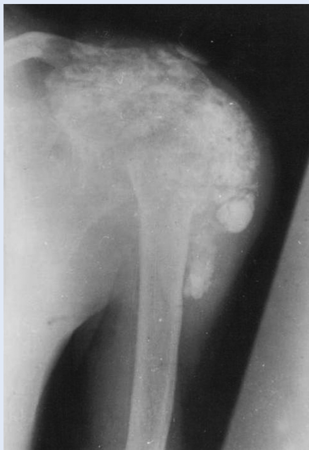
Slika 2. Kalcifikacije mekog tkiva lijevog ramena u bolesnika s terminalnim bubrežnim zatajenjem na liječenju hemodijalizom Figure 2. Soft tissue calcifications in a patient with end stage renal disease on dialysis, left shoulder

Ultrazvukom se može odrediti veličina i lokalizacija povećanih paratireoidnih žlijezda (slika 5). To je neinvazivna, jeftina, danas vrlo dostupna pretraga koje se može češće ponavljati 23,24 . Pod kontrolom ultrazvuka može se učiniti citološka punkcija paratireoidnih žlijezda koja nam definitivno može dati potvrdu radi li se o povećanim paratireoidnim žlijezdama. Na osnovi veličine paratireoidnih žlijezda možemo procijeniti radi li se o difuznoj