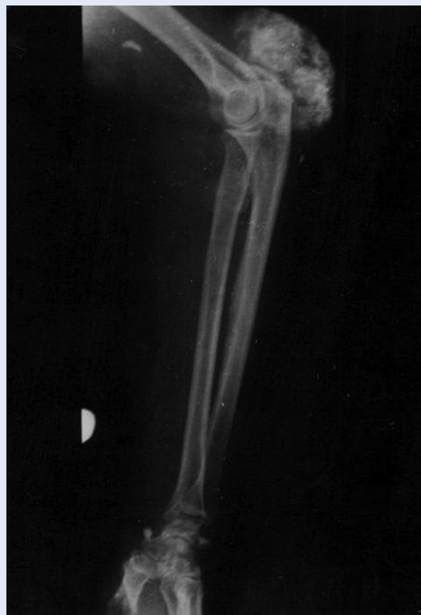
Slika 3. Kalcifikacije mekog tkiva lakta u bolesnika s terminalnim bubrežnim zatajenjem na liječenju hemodijalizom Figure 3. Soft tissue calcifications in a patient with end stage renal disease on dialysis, elbow