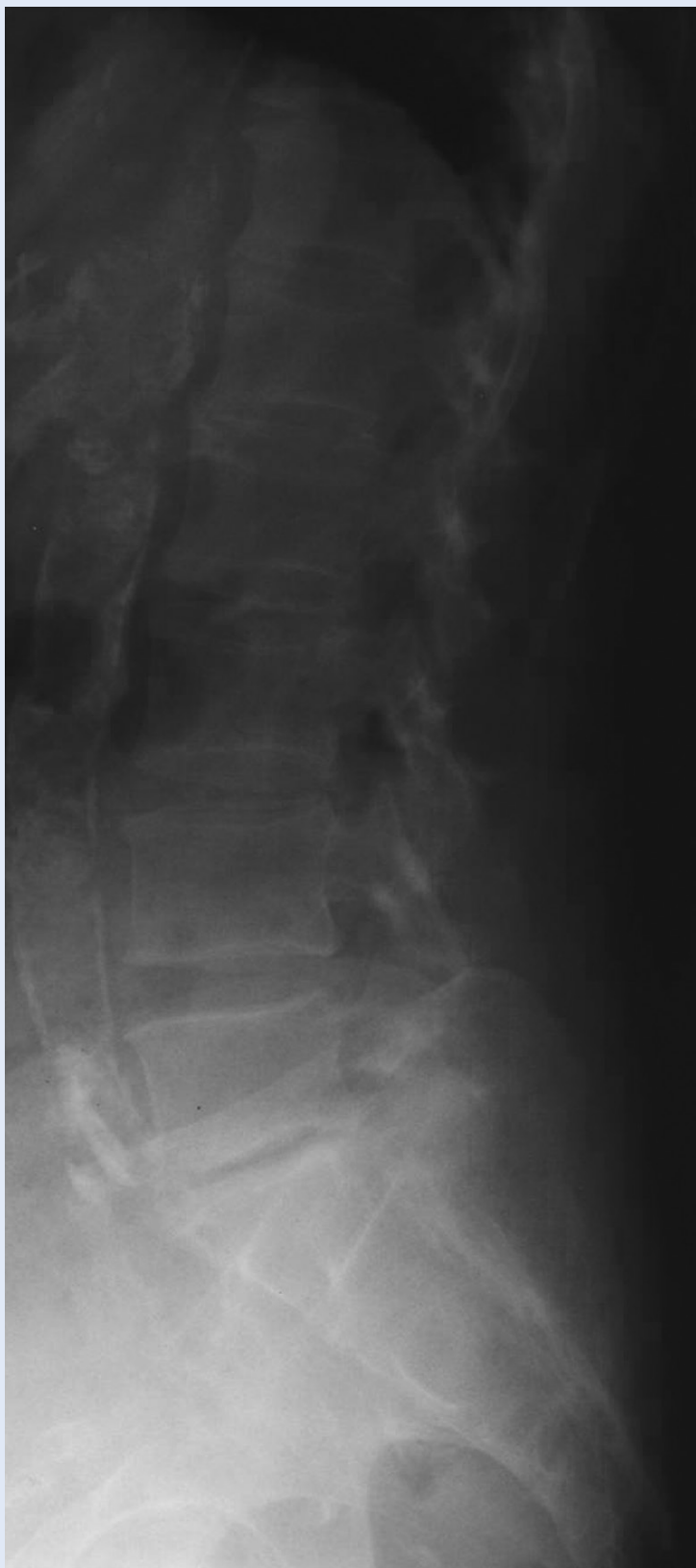
Slika 4. Multiple kalcifikacije u abdominalnoj aorti u bolesnika s terminalnim bubrežnim zatajenjem na liječenju hemodijalizom Figure 4. Multiple calcifications in a patient with end stage renal disease on dialysis, abdominal aorta.

hiperplaziji ili o nodularnoj hiperplaziji koja je znatno teži oblik hiperparatireoidizma 24 .