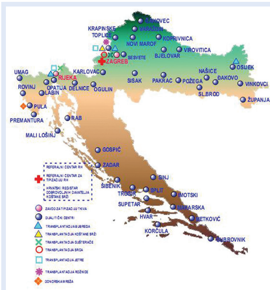
Slika 2. Mreža centara za dijalizu, transplantacijskih centara i centara za tipizaciju tkiva u Republici Hrvatskoj. Više od 50 centara za dijalizu govori o razvijenosti liječenja nadomještanjem bubrežne funkcije u našoj zemlji (prilagođeno prema referenci 1).

Nadomještanje bubrežne funkcije u svim segmentima doživjelo je razvoj sljedećih godina zahvaljujući entuzijazmu i predanom radu generacija liječnika, medicinskih sestara i tehničara te drugog osoblja u današnjem Kliničkom bolničkom centru u Rijeci.