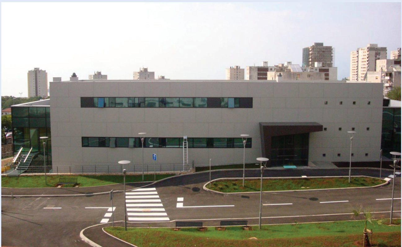
Slika 4. Nova reprezentativna zgrada Zavoda za nefrologiju i dijalizu na lokalitetu Sušak Kliničkog bolničkog centra u Rijeci i nastavne baze Medicinskog fakulteta Sveučilišta u Rijeci.

Figure 4. The new representative building of the Department for Nephrology and Dialysis in the University Hospital Center Rijeka and Medical faculty, University of Rijeka.