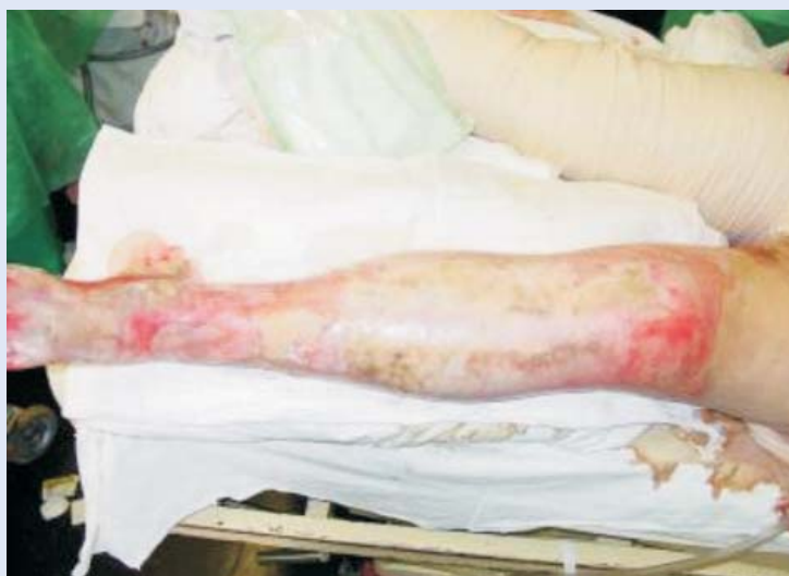
Slika 2. II b stupanj opeklina

Od 132 bolesnika, 40 bolesnika (30.3 %) bile su žene, a 92 (69.7 %) muškarci. Srednja dob bolesnika bila je 43.95 \pm 16.99 godina. Od ukupnog broja, 36 (21.3 %) bolesnika imalo je opekline koje su sačinjavale manje od 20 % tjelesne površine, a 96 (72.7 %) bolesnika imalo je opeklinama zahvaćeno više od 20 % površine tijela. Na grafikonu 1 prikazan je stupanj opeklini u ispitanih bolesnika. Prema lokalizaciji opeklini, najčešće su bili zahvaćeni gornji ekstremiteti u 88 bolesnika (32.4 %), zatim glava i vrat u 82 bolesnika (30.1 %), donji ekstremiteti u 62 bolesnika (22.8 %), trup u 37 bolesnika (13.6 %), te je u 3 bolesnika bila prisutna opeklini uzrokovana inhalacijom (1.1 %). Komorbiditet je utvrđen u 22 bolesnika: hipertenzija je bila prisutna u 7 bolesnika (31.8 %), diabetes mellitus u 7 (31.8 %), psihijatrijski poremećaji u 5 (22.7 %), alkoholizam u 3 (13.6 %), dok je epilepsija utvrđena u 2 bolesnika (9.1 %). Na tablici 1 prikazani su