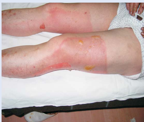
Slika 1. II a stupanj opekline Figure 1. II a degree burn

dermis je zahvaćen i dermis, a u kliničkoj slici javljaju se bule uz eritem i edem. Opekline ovog stupnja dijele se na dvije skupine: površne dermalne opekline (stupanj II a) koje zahvaćaju epidermis i papilarni dio dermisa, te duboke dermalne opekline (stupanj II b) koje zahvaćaju epidermis i dermis u cijelosti. Epitelizacija površnih dermalnih opekline je u pravilu potpuna, ali sporija, uz moguć nastanak sekundarnih hiperpigmentacija i hipopigmentacija (slika 1). Duboke dermalne opekline sporo cijele, ostavljaju oštećen epitel, hipertrofične ožiljke, a moguć je nastanak funkcionalnih poremećaja (slika 2). U ope-