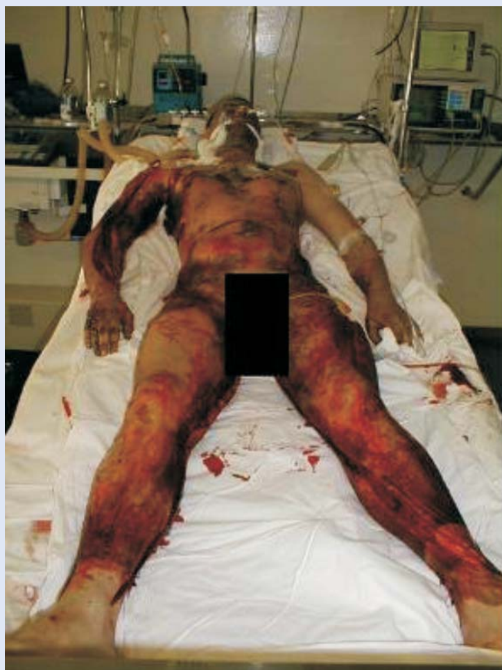
Slika 3. III stupanj opeklina izazvan plamenom

Figure 3. III degree burn caused by open flame