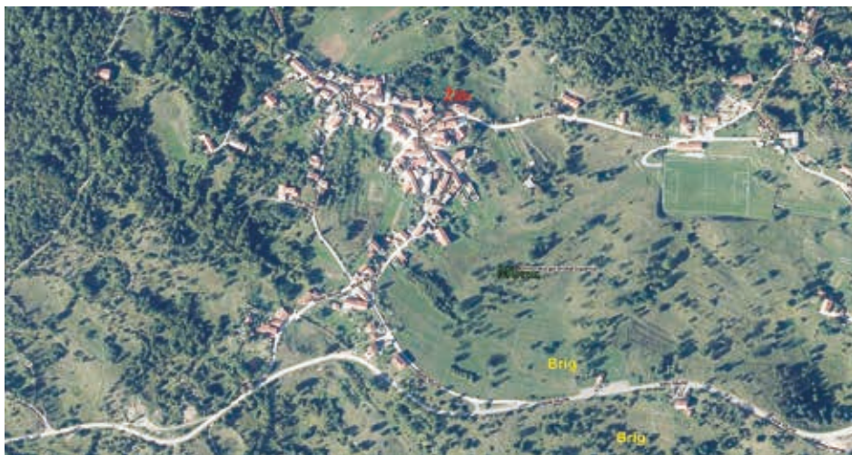
Slika 2. Lokaliteti Brig i Žlib u katastarskoj općini Mune.