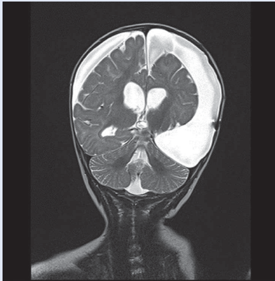
Slika 2. Stanje nakon ekspiracije tumora s posljedičnim parenhimnim deficitom i poslijeoperacijskim ožiljnim promjenama uz vidljive obostrane subduralne higrome – lijevo promjera 20-30 mm, desno 15 mm

nom u smislu formiranja opsežnih higroma (Slika 2). Naknadno je učinjena molekularno-citogenetička analiza tumorskoga tkiva u stranom laboratoriju i identificirana je fuzija YAP1-MAMLD1 7 . U daljnjem tijeku redovito je klinički i slikovno praćena. Osam godina nakon završenog liječenja djevojčica je bez znakova bolesti i urednog tjelesnog i intelektualnog razvoja. Zbog kasnih je dentalnih komplikacija (oligomikrodoncija) pod nadzorom stomatologa.