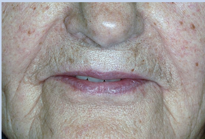
Slika 2. Ispitivanje duljine gornjih sjekutića izgovorom suglasnika /f/ Figure 2. Evaluation of the upper incisors length by /f/ articulation

Glasovi /f/ i /v/ su labiodentalni suglasnici koji nastaju u fiziološkom položaju mirovanja jezika, a isključivo dodiranjem donje usne s incizalnim bridovima gornjih sjekutića (slika 2). Gornji sjekutići dodiruju donju usnu upravo na prijelazu vanjske sluznice na unutarnju sluznicu usne šupljine. Tijekom probe postave prednjih zubi potrebno je ispitati i po potrebi ispraviti trodimenzionalni