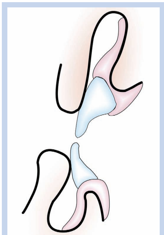
Slika 1. Položaj središnjih sjekutića i jezika u položaju najmanjeg govornog razmaka

Raspodjela prostora vertikalne okluzijske dimenzije ovisi i o položaju okluzijske ravnine koja leži na okluzijskim plohama i incizalnim bridovima antagonističkih zubi gornjeg i donjeg zubnog niza. Kad je sačuvan veći broj prirodnih zubi, relativno je jednostavno rekonstruirati okluzijsku ravninu. Kod malog broja prirodnih zubi ili njihova potpunog gubitka treba u radnim fazama izradbe proteze odrediti odnos ekvatora jezika i postave umjetnih zubi. Ispravna okluzijska ravnina pridonosi stabilizaciji proteza uz primjeren odnos jezika, umjetnih zubi i usana, što omogućuje i dobar izgovor 1,23,24 .