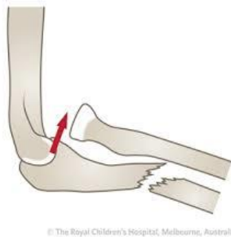
Slika 4. Monteggia fraktura

ove vrste prijeloma kao komplikacija može doći do ozljede stražnje grane radijalnog živca. U posljednjem tipu dolazi do prijeloma u predjelu dijafiza radijusa i ulne uz prednju luksaciju glavice radijusa; te je ovaj tip najrjeđi od svih Monteggia prijeloma (1%). Klinička slika je više-manje ista u svih ovih tipova, a to je: otok, bolnost, smanjena pokretljivost i moguća deformiranost. Naposljetku imamo izolirane prijelome proksimalnog dijela podlaktičnih kostiju i iznose otprilike 10% svih prijeloma podlaktice u velikoj većini slučajeva budu zahvaćene obje kosti (ulna i radijus), dok u slučajevima gdje dolazi do izoliranog prijeloma, fragment je u potpunosti odmaknut. Ovi prijelomi su najčešće rezultat direktnog udarca u predio lakta. Zbog svog obilnog mišićnog omotača koji okružuje kosti ovaj tip prijeloma je praćen manjim otokom, no zbog istog razloga manualna repozicija je otežana. [5,6,8]