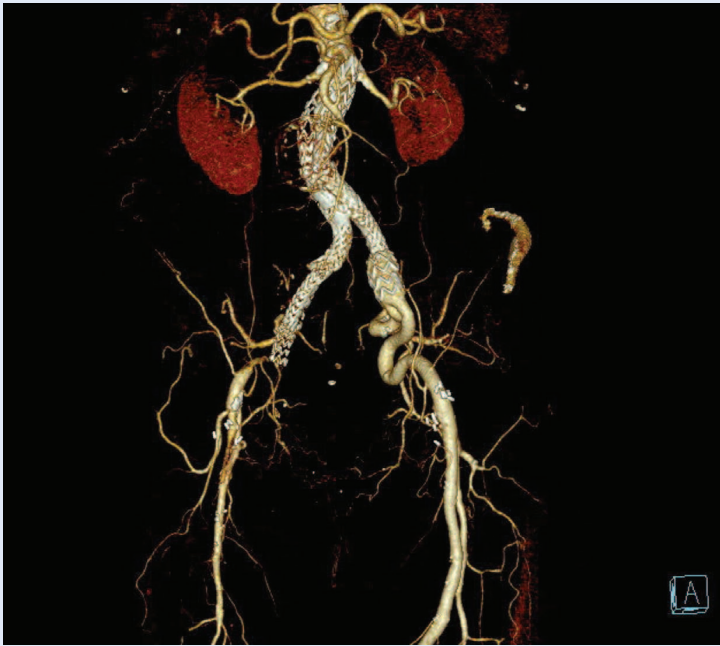
Slika 4. VRT rekonstrukcija – okluzija desnog kraka EVAR-a

dok tip V označava rast aneurizmske vreće bez detektabilnog protoka u aneurizmi raznim tehnikama oslikavanja (endotenzija) 4 . Praćenjem bolesnika dominantno nalazimo endoleak tipa II, koji predstavlja retrogradno punjenje aneurizmske vreće visceralnim i lumbalnim ograncima, dok u kirurške opcije ubrajamo sakotomiju i ligaciju lumbarnih i/ili donje mezenterične arterije 1 . Endoleak tipa II u naravi je „benigni“ tip, ali je povezan s kasnim porastom aneurizmske vreće, stoga je praćenje bolesnika ključno 1,32 . Liječi se primarno minimalno invazivnim metodama, u koje ubrajamo translumbalnu ili transkavalnu punkciju i aplikaciju okluzivnog tekućeg sredstva u aneurizmsku vreću ili endovaskularnu embolizaciju donje mezenterične arterije, ako je došlo do progresije rasta aneurizme 33,34 . Okluzija donje mezenterične arterije nosi rizik od ishemije kolona 4 . Endoleak tipa I najčešći je uzrok sekundarne rupture. Razvoj novih endovaskularnih stent-graftova i tehnika, kao što su fenestrirani i razgranati ( branched ) endograftovi, smanjilo je potrebu za sekundarnim kirurškim intervencijama, ali važno je napomenuti da plasiranje dodatnih endograftova može dodati kompleksnosti kasnijem sekundarnom kirurškom zbrinjavanju 1 . Kod tipova III, IV i V, kada se prati porast aneurizmske vreće, najčešće je potrebna kirurška konverzija 1,4 .