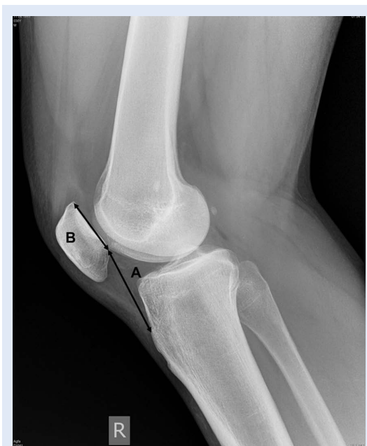
Slika 3. Profilni radiogram koljena kod mjerenja visine patele modificiranom Insall-Salvatijevom metodom: A – udaljenost od donjeg ruba zglobne plohe patele do hvatišta ligamenta patele za tuberositas tibiae , B – dužina zglobne plohe patele