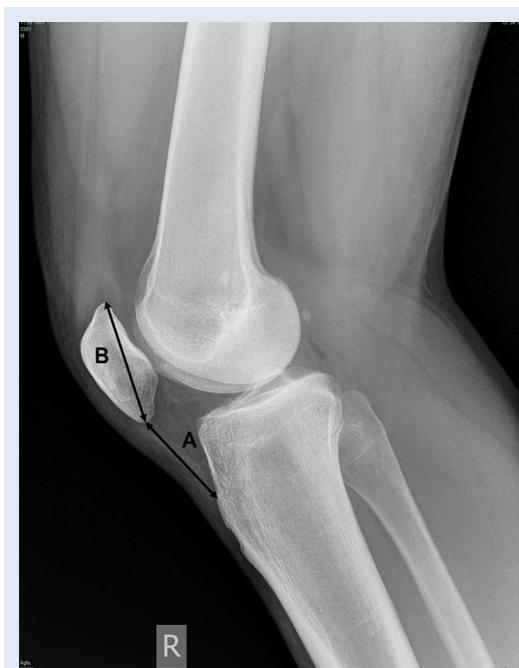
Slika 2. Profilni radiogram koljena kod mjerenja visine patele Insall-Salvatijevom metodom: A – dužina ligamenta patele, B – dužina patele