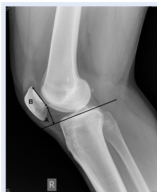
Slika 4. Profilni radiogram koljena kod mjerenja visine patele Blackburn-Peelovom metodom: A – dužina koja je okomita na pravac koji tangencijalno prolazi gornjom plohom tibijalnog platoa, a proksimalno vodi do donjeg ruba zglobne plohe patele, B – dužina zglobne plohe patele