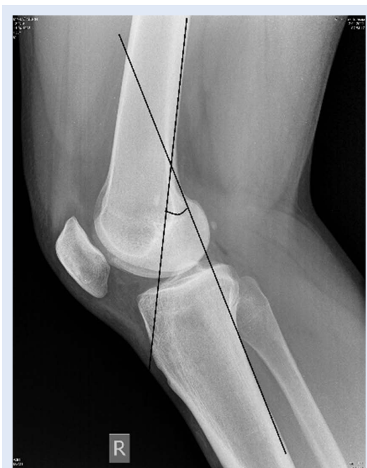
Slika 1. Profilni radiogram koljena koji prikazuje način mjerenja veličine fleksije koljena pomoću veličine kuta na sjecištu tangenti stražnjeg korteksa femura i tibije