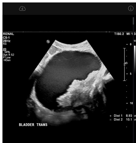
Slika 1 Ultrazvučni prikaz karcinoma mokraćnog mjehura. Preuzeto s: (8)

su neki krajevi, poput suptropskog i tropskog pojasa, naseljeni metiljem Shistosomom koja je jedan od etioloških čimbenika nastanka. Također, potrebno je pažnju posvetiti socijalnoj anamnezi. Vrsta rada i rad s anilinskim bojama smatramo uzročnikom karcinoma mokraćnog mjehura. U fizikalnom statusu potrebno je dodatno palpirati mokraćni mjehur i uključiti ultrazvuk bubrega i mokraćnog mjehura. Prije daljnje dijagnostike potrebno je učiniti laboratorijski pregled sedimentacije urina i citološki pregled istog. (2) Zlatni standard dijagnostike tumora mokraćnog mjehura je cistoskopija te nakon nje transuretralna resekcija prilikom koje se uzima suspektna promjena za patohistološku analizu. U nekih bolesnika indicirana je magnetska rezonanca (MR) ili kompjuterska tomografija (CT) za evaluaciju proširenosti bolesti. Na sljedećim slikama prikazane su radiološke metode dijagnostike tumora mokraćnog mjehura (slika 1 i 2).