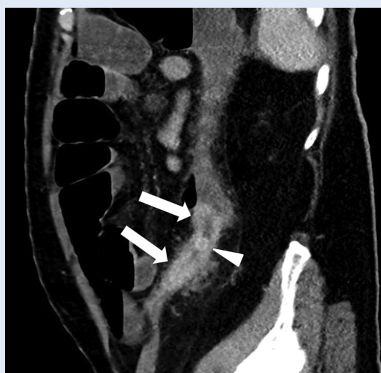
Slika 2. CT abdomena u istog pacijenta, sagitalna rekonstrukcija

karcinoma peritoneuma zbog koje se odustalo od zahvata. Prije otpusta iz bolnice bolesnik je bio dobrog općeg stanja te je tada otpušten na kućnu njegu. Potom je bio upućen na Kliniku za onkologiju gdje je bilo odlučeno da pacijent započne s ciklusima kemoterapije. Nakon izvršenog 12. ciklusa kemoterapije pacijent se dobro osjećao, bez novonastalih tegoba, te je otpušten kući s preporukom nastavka korištenja svoje kronične i simptomatske terapije.