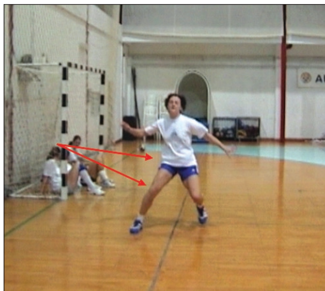
Slika 3. Naglo mijenjanje smjera s koljenom u valgus poziciji uz fiksirano stopalo, treba zamijeniti polukružnom kretnjom sa savijenim koljenom.

Figure 3. Changing direction with the knee in valgus position and fixed foot change in accelerated round turn with bent knee.