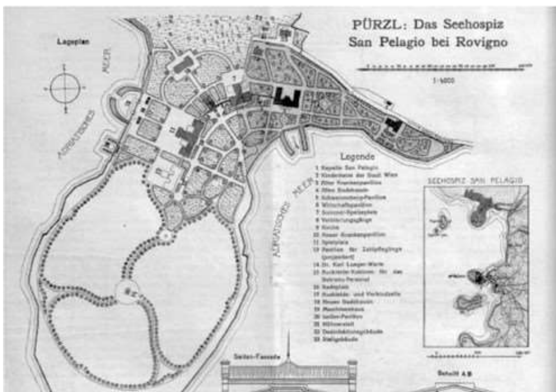
Slika 2. Dječja bolnica u Rovinju.

Pürzla (1852. - 1930.) i arhitekta Juliusa Fröhlicha 31 (1853. - 1923.) i građevinskog pomoćnika Viktora Fuchsa. Strojarski i električni sustavi te dizala/liftovi izvedeni su pod vodstvom gradskog vijećnika Gustava Klosea. Građevinski radovi započeli su u kolovozu 1907. i dovršeni su svibnju 1908. Ukupni troškovi iznosili su 910.000 kruna. 32 Temeljem plana iz 1910. dječja bolnica je temeljito proširena. Iz plana vidljivo je da se novi bolnički sklop sastojao od gospodarskog paviljona, crkve, starog bolničkog paviljona, starog bazena za kupanje, doma za djecu grada Beča, Paviljona za izolaciju, ljetnu blagovaonicu, štale, zgrade za dezinfekciju i velikog uređenog parka unutar kojeg se nalazio vidikovac dr. Karla Luegera. Ukratko površina cijelog kompleksa iznosila je nešto više od 32 ha i na njegovoj realizaciji radili su brojni inženjeri, arhitekti i liječnici. 33