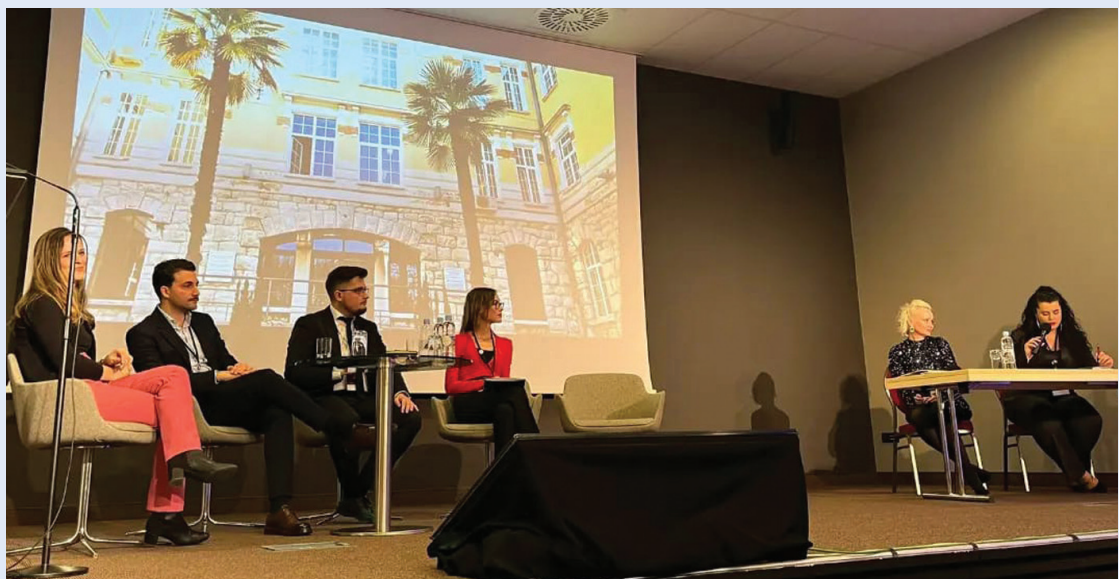
Slika 9. Studentska sekcija kao jedan od organizatora MedRi 2023 Conference – First International Student Symposium on Future Doctors Educating the World

Budući da je Studentska sekcija posvećena popularizaciji znanosti u medicini i poticanju studentske znanstvene aktivnosti, Science Sunday je uspješna inicijativa koja redovnim objavljivanjem članaka o najnovijim istraživanjima i medicinskim temama pridonosi obogaćivanju znanja studenata medicine i potiče interes za znanstvenim istraživanjima. Ova inovativna strategija može poslužiti kao primjer drugim studentskim sekcijama i organizacijama koje žele promicati znanost među mladima. Nedjeljom navečer, kada svi uglavnom „skrolaju“ po društvenim mrežama, u ogromnoj količini informacija i podražaja Science Sunday skreće pažnju pratitelja na provjerene, životno primjenjive i zanimljive informacije (Slika 10). Ovaj format educira pratitelje o brojnim novostima iz različitih područja znanosti te se na taj način promovira istraživanje i kritičko razmišljanje. S druge strane, svojom kratkoćom i jednostavnošću zadržava pažnju šire