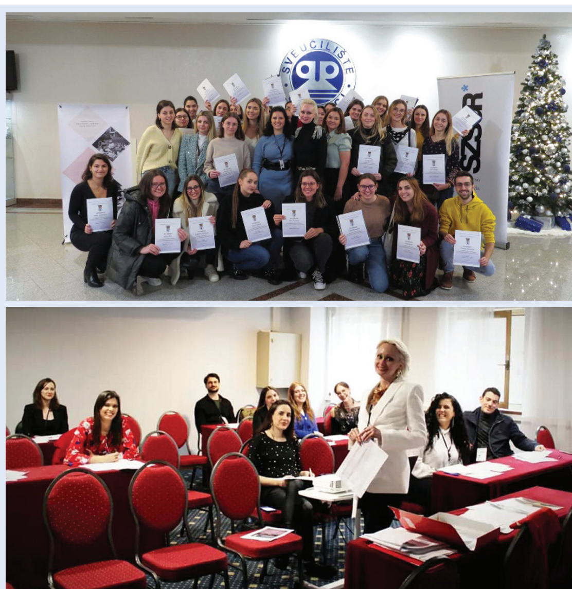
Slika 7. Radionica Sve što studenti trebaju znati o znanosti na praktičan način u 120 minuta u okviru MedRi Znanstvenog PIKNIK-a i MedRi 2023 Conference

Radionica Sve što studenti trebaju znati o znanosti na praktičan način u 120 minuta najnovija je radionica u organizaciji Studentske sekcije, stvorena u drugom kreativnom uzletu 2022. godine. Prvi put je provedena u sklopu MedRi Znanstvenog PIKNIK-a u organizaciji studenata Medicinskog fakulteta u Rijeci u prosincu 2022. godine te potom na MedRi 2023 – First International Conference on Teaching and Learning in Medical Education , odnosno u sklopu First International Student Symposium on Future Doctors Educating the World u ožujku 2023. godine (Slika 7). Cilj ra-