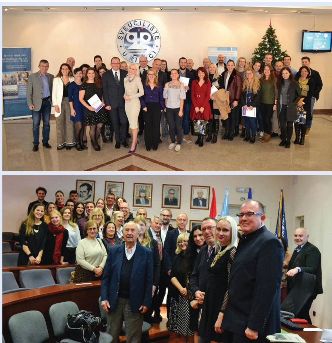
Slika 3. Promocija prvog i drugog studentskog broja časopisa Medicina Fluminensis

Nakon izuzetno uspješne prve godine djelovanja, u prosincu 2018. godine objavljen je prvi tematski broj časopisa Medicina Fluminensis posvećen isključivo prvoautorskim studentskim znanstvenim člancima 5 . U tematskom broju objavljeno je čak 15 znanstvenih članaka, uključujući odabrana najbolja konferencijska priopćenja na studentskim znanstvenim skupovima u organizaciji Medicinskog fakulteta u Rijeci, kao i najbolje napisane prikaze slučajeva koje su izradili studenti na radionici Kako napisati dobar prikaz slučaja (Slika 3).