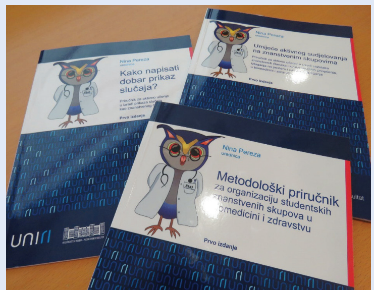
Slika 6. Priručnici Studentske sekcije

pretvoren u izborni kolegij na petoj godini sveučilišnog integriranog prijediplomskog i diplomskog studija Medicina na Medicinskom fakultetu u Rijeci. Radionicu i izborni kolegij prate dva priručnika – Metodološki priručnik za organizaciju studentskih znanstvenih skupova u biomedicini i zdravstvu te Umijeće aktivnog sudjelovanja na