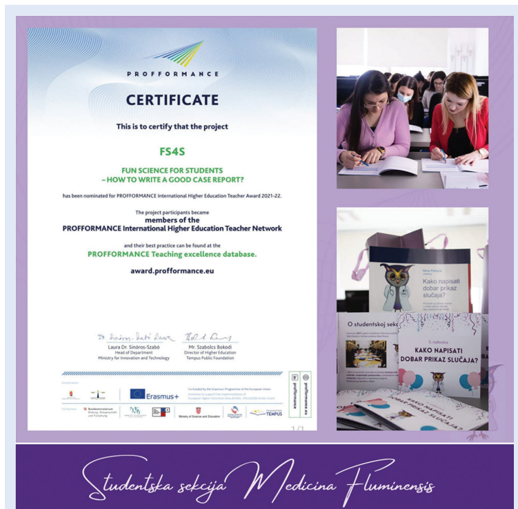
Slika 5. Uključenje radionice Kako napisati dobar prikaz slučaja u PROFFORMANCE Teaching excellence database

Ciljevi radionice su omogućiti stjecanje temeljnih znanja o znanstvenim djelima, s naglaskom na znanstvene članke i konferencijska priopćenja, kao i vještina pisanja sažetaka znanstvenog članka i konferencijskog priopćenja te izrade izlaganja na posteru i usmenog izlaganja. S obzirom na uspjeh održanih radionica, ovaj je oblik edukacije