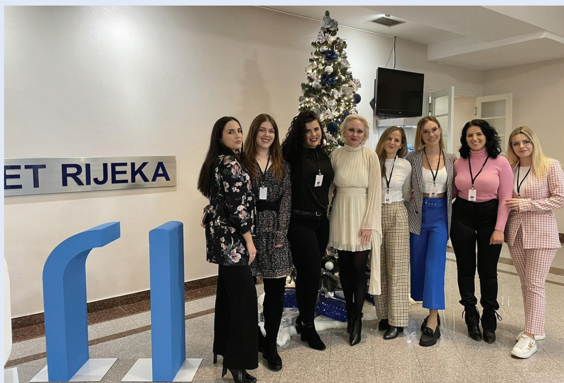
Slika 12. Studentska sekcija Medicina Fluminensis 2022. godine

i educirati javnost o važnosti znanosti u današnjem svijetu. Uz strast prema znanosti i predanost promicanju studentske znanstvene aktivnosti, vjerujemo da možemo oblikovati bolju budućnost ne samo za studente Medicinskog fakulteta u Rijeci nego i za fakultete sa susjednih područja.