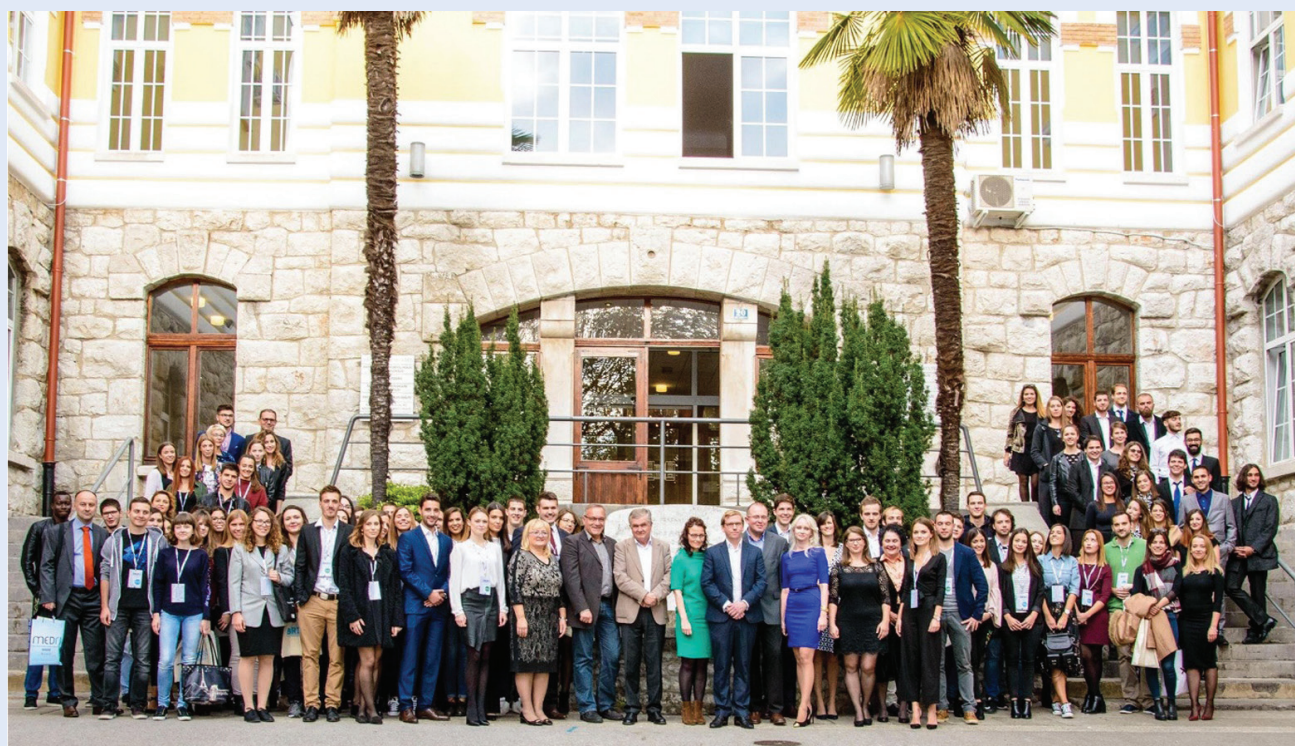
Slika 1. Prvi međunarodni biomedicinski kongres u Rijeci (BRIK)

Studentska je sekcija edukacijska baza koja omogućuje stjecanje znanja i vještina iz znanstvene metodologije, nastojeći osnažiti studente i pružiti im sigurnost u strukturnom okviru kako bi u svojim znanstvenim aktivnostima mogli postići najvišu razinu kreativne slobode te potaknuti studente na bavljenje znanosti koja je istovremeno životna i primjenjiva uz postelju pacijenta.