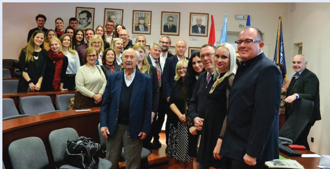
Slika 3. Promocija prvog i drugog studentskog broja časopisa Medicina Fluminensis