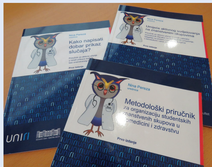
Slika 6. Priručnici Studentske sekcije

pretvoren u izborni kolegij na petoj godini sveučilišnog integriranog prijediplomskog i diplomskog studija Medicina na Medicinskom fakultetu u Rijeci. Radionicu i izborni kolegij prate dva priručnika – Metodološki priručnik za organizaciju studentskih znanstvenih skupova u biomedicini i zdravstvu te Umijeće aktivnog sudjelovanja na