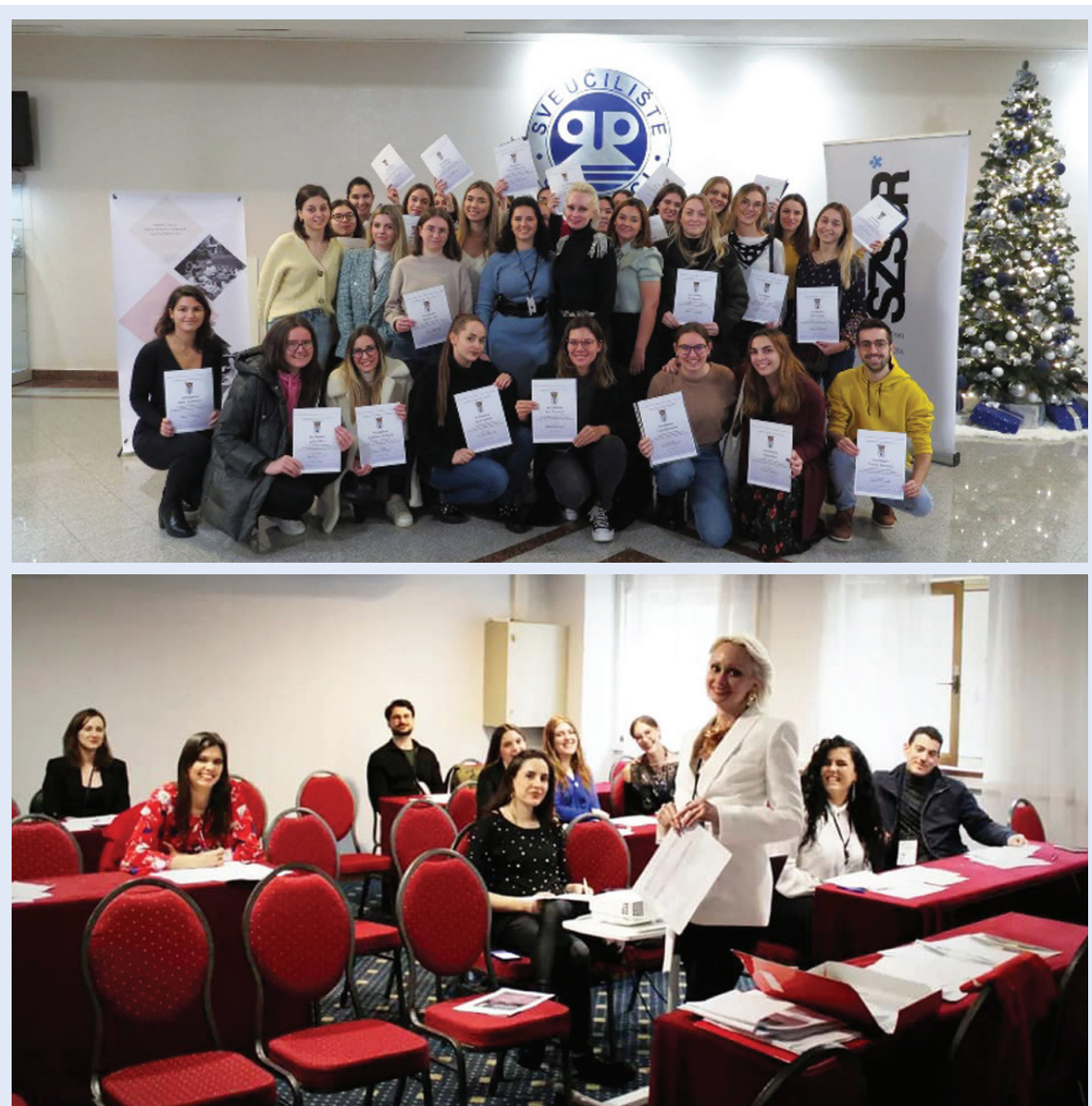
Slika 7. Radionica Sve što studenti trebaju znati o znanosti na praktičan način u 120 minuta u okviru MedRi Znanstvenog PIKNIK-a i MedRi 2023 Conference

Radionica Sve što studenti trebaju znati o znanosti na praktičan način u 120 minuta najnovija je radionica u organizaciji Studentske sekcije, stvorena u drugom kreativnom uzletu 2022. godine. Prvi put je provedena u sklopu MedRi Znanstvenog PIKNIK-a u organizaciji studenata Medicinskog fakulteta u Rijeci u prosincu 2022. godine te potom na MedRi 2023 – First International Conference on Teaching and Learning in Medical Education , odnosno u sklopu First International Student Symposium on Future Doctors Educating the World u ožujku 2023. godine (Slika 7). Cilj ra-