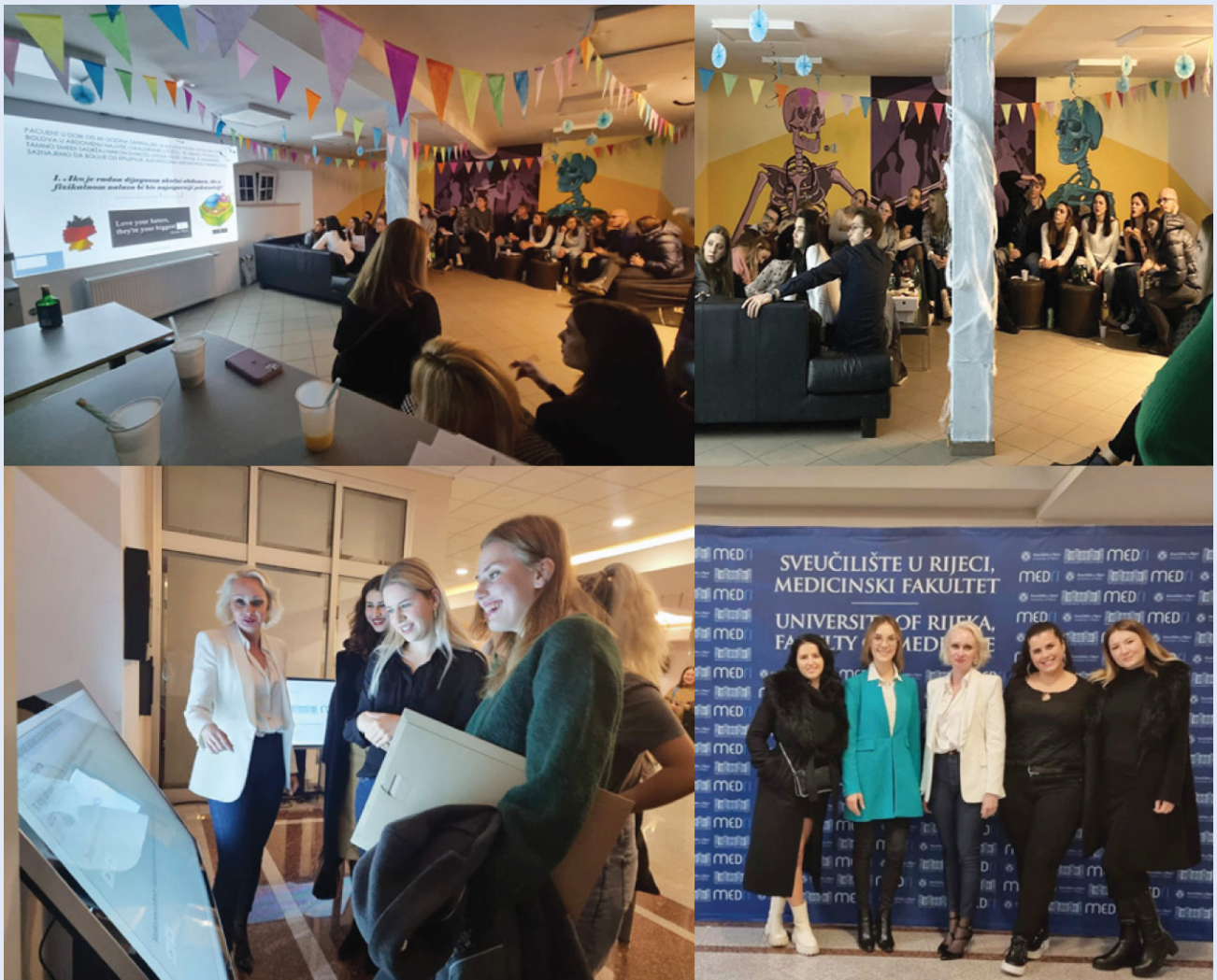
Slika 11. Case night i Nobula Case Creator

S obzirom na sve navedeno, vjerujemo da ovakvi događaji pružaju izvrsnu priliku za razvoj timskog rada i produbljivanje znanja među studentima, vještina koje su korisne ne samo u medicini već i u širem kontekstu života