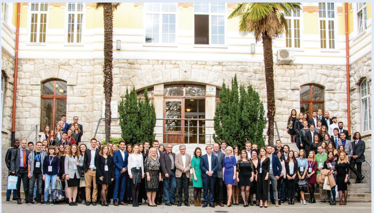
Slika 1. Prvi međunarodni biomedicinski kongres u Rijeci (BRIK)

Studentska je sekcija edukacijska baza koja omogućuje stjecanje znanja i vještina iz znanstvene metodologije, nastojeći osnažiti studente i pružiti im sigurnost u strukturnom okviru kako bi u svojim znanstvenim aktivnostima mogli postići najvišu razinu kreativne slobode te potaknuti studente na bavljenje znanostima koja je istovremeno životna i primjenjiva uz postelju pacijenta.