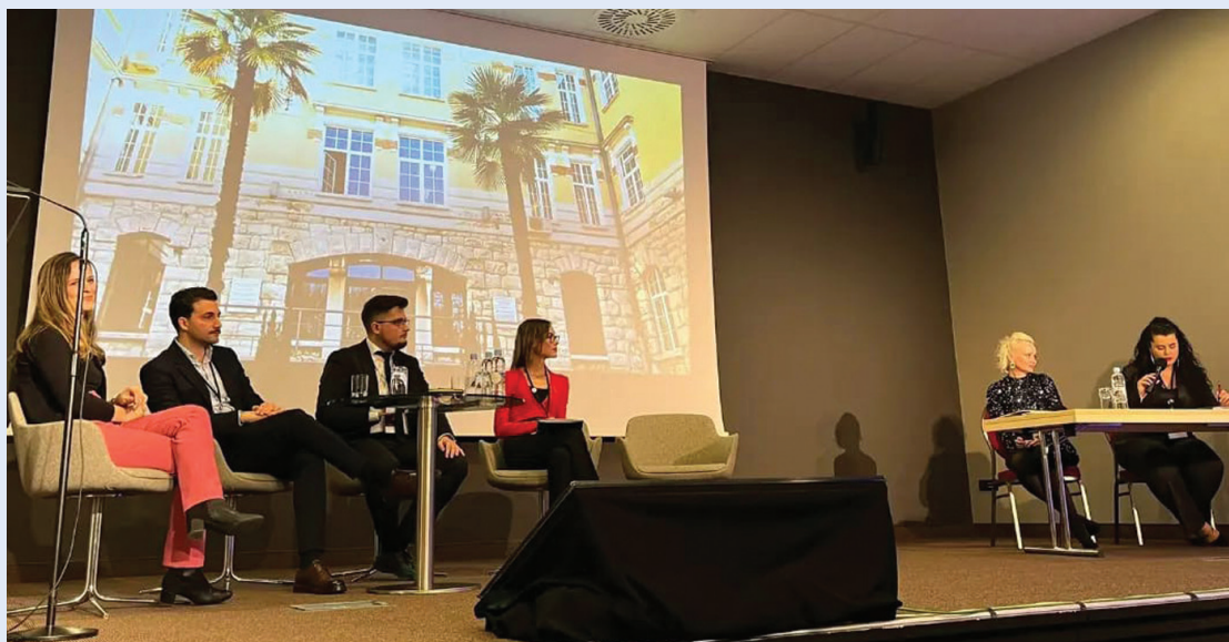
Slika 9. Studentska sekcija kao jedan od organizatora MedRi 2023 Conference – First International Student Symposium on Future Doctors Educating the World

Budući da je Studentska sekcija posvećena popularizaciji znanosti u medicini i poticanju studentske znanstvene aktivnosti, Science Sunday je uspješna inicijativa koja redovnim objavljivanjem članaka o najnovijim istraživanjima i medicinskim temama pridonosi obogaćivanju znanja studenata medicine i potiče interes za znanstvenim istraživanjima. Ova inovativna strategija može poslužiti kao primjer drugim studentskim sekcijama i organizacijama koje žele promicati znanost među mladima. Nedjeljom navečer, kada svi uglavnom „skrolaju“ po društvenim mrežama, u ogromnoj količini informacija i podražaja Science Sunday skreće pažnju pratitelja na provjerene, životno primjenjive i zanimljive informacije (Slika 10). Ovaj format educira pratitelje o brojnim novostima iz različitih područja znanosti te se na taj način promovira istraživanje i kritičko razmišljanje. S druge strane, svojom kratkoćom i jednostavnošću zadržava pažnju šire