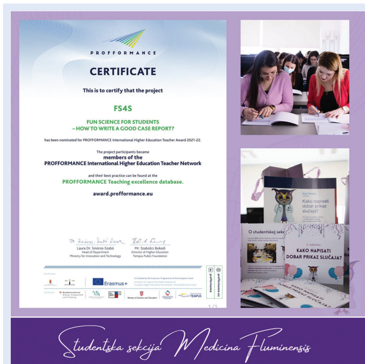
Slika 5. Uključenje radionice Kako napisati dobar prikaz slučaja u PROFFORMANCE Teaching excellence database

Ciljevi radionice su omogućiti stjecanje temeljnih znanja o znanstvenim djelima, s naglaskom na znanstvene članke i konferencijska priopćenja, kao i vještina pisanja sažetaka znanstvenog članka i konferencijskog priopćenja te izrade izlaganja na posteru i usmenog izlaganja. S obzirom na uspjeh održanih radionica, ovaj je oblik edukacije