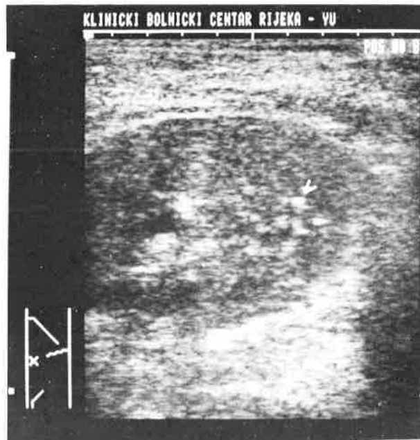
Slika 2. Polukosi linearni presjek istog bubrega tijekom terapije; primjećuje se znatna redukcija edema medule, a u parenhimu se vide još uvijek vrlo rijetki mjehurići plina (strelica); prikaz tijekom terapije

Provedena je terapija kombinacijom antibiotika, a regresija pijelonefritičkog procesa praćena je sonografski. Prilikom prvog kontrolnog pregleda utvrđeno je znatno poboljšanje sonografske slike lijevog bubrega, uz popratni nalaz izljeva u lijevom prsištu, koji je kasnije radiološki potvrđen. Na drugom kontrolnom pregledu pronađene su minimalne kronične pijelonefritičke promjene bez ranije opisanih znakova emfizematoznog pijelonefritisa (sl. 2,3).