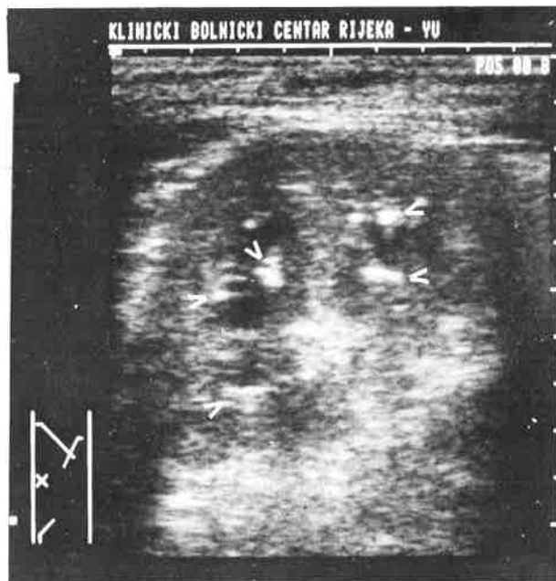
Slika 1. Aksijalni linearni presjek uvećanog lijevog bubrega sa izraženim edemom medule; strelice pokazuju mjehuriće plina unutar bubrežnog parenhima (početak terapije)

Ultrazvučnim pregledom utvrđeno je lagano uvećanje lijevog bubrega uz blago reducirani parenhim difuzno prožet sitnim hiperehogenim arealima s fenomenom reverberacije i posteriorne mjestimične atenuacije ultrazvučnog snopa. Zaključeno je da se najvjerojatnije radi o rijetkoj sonografskoj slici emfizematoznog pijelonefritisa (sl. 1).