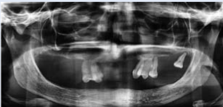
Slika 1. RTG snimak s vrlo atrofičnom gornjom čeljusti

Implantoprotetska rehabilitacija vrlo atrofične maksile predstavlja priličan izazov. Naime za postavu dentalnog implantata osnovni preduvjet je dovoljna količina kosti u kojoj se može integrirati implantat zadanih dimenzija.