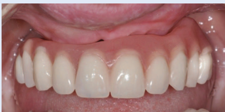
Slika 5. Privremeni protetski nadomjestak fiksiran na implantate