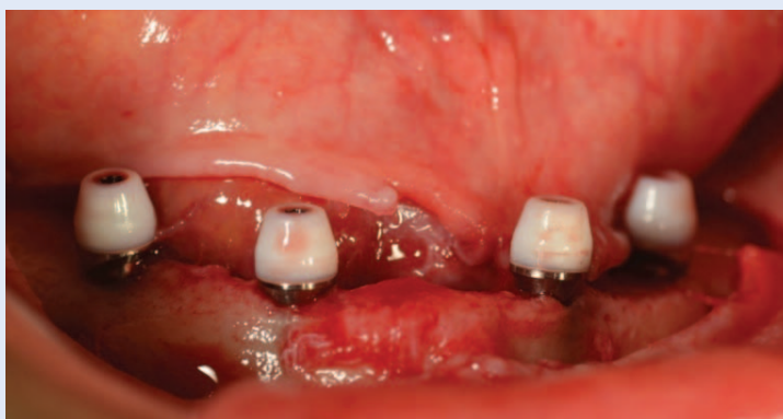
Slika 3. Postavljeni implantati u donjoj čeljusti tehnikom all-on-four

Prije samog kirurškog zahvata izrađena je privremena proteza s topopolimerizirajućim akrilatom (Ivoclar high-impact acrylic, Ivoclar Vivadent, Schaan, Liechtenstein). Nakon kirurškog zahvata uzet je definitivni otisak otvorenim žlicom na postavljene multiunit nadogradnje (Nobel Biocare) koristeći visoko precizni adicijski silikon (Ivoclar Vivadent, Schaan, Liechtenstein) (slika 4). Odmah nakon kirurškog zahvata i uzimanja otiska privremena proteza je modificirana na definitivnom modelu u dentalnom laboratoriju koristeći hladno polimerizirajući akrilat (Probase, Ivoclar Vivadent). Ovako modificirana akrilatna proteza fiksirana je pomoću vijaka na implantate drugi dan nakon operacije (slika 5). Pacijentica je upućena kako treba održavati oralnu higijenu te naručena na kontrolne preglede nakon tjedan dana, tri tjedna i tri mjeseca. Nakon četiri mjeseca započeta je izrada definitivnog protetskog nadomjestka.