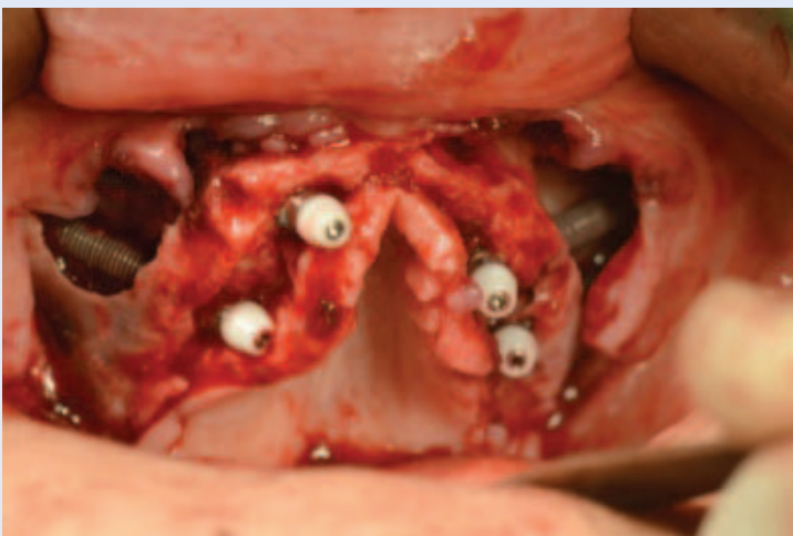
Slika 2. Postavljeni zigomatični implantati s protetskim nadogradnjama

Rehabilitacija vrlo atrofične maksile može se postići upotrebom zigomatičnih implantata. Radi se o tehnici koju je još 1988. godine predložio Branemark, a 1998. godine objavljeni su prvi rezultati s vrlo visokim postotkom uspješnosti (97 %). U sljedećih nekoliko godina objavljeno je još nekoliko studija u kojima se referira uspješnost od preko 90 %, što afirmira zigomatične implantate kao vrlo sigurnu metodu u oralnoj rehabilitaciji pacijenata s teškom atrofijom maksile, a koriste se i u slučajevima koštanih deficita nakon onkoloških zahvata na maksili 7,8 .