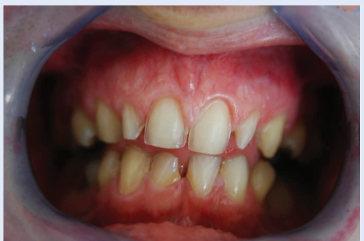
Slika 4. Adekvatna preparacija za e.max press ljuske