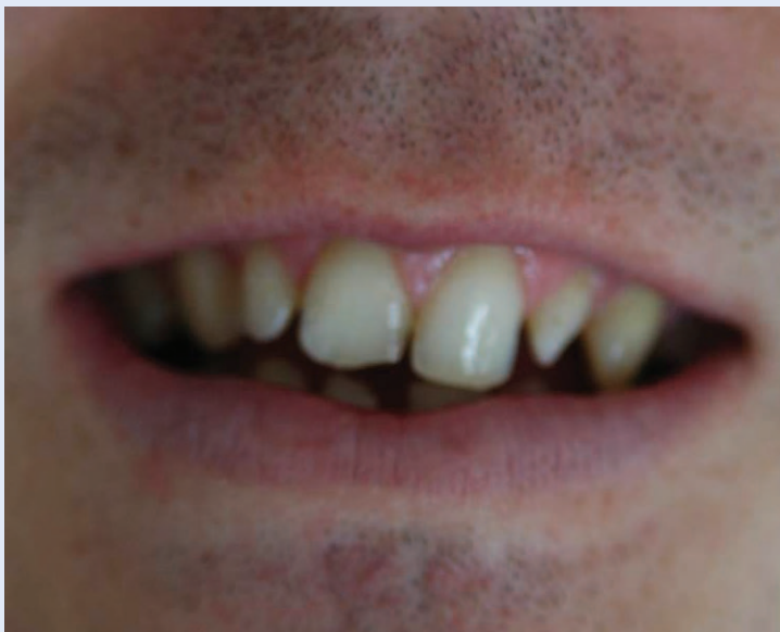
Slika 1. Izgled inicijalne situacije koja pokazuje odstupanje u obliku zuba 13, 12, 11, 21, 22, 23

Pomno planiranje izrade nadomjestka, koje uključuje odabir odgovarajućeg materijala, dijagnostičko navoštavanje i izradu privremenih nadomjestaka koji pružaju uvid u ishod terapije te uska suradnju pacijenta, doktora dentalne medicine i dentalnog tehničara, preduvjet su uspješnosti terapije.