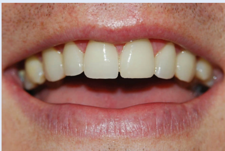
Slika 5. Izgled cementiranih e.max press ljuski u ustima pacijenta

Osim što poboljšava funkciju stomatognatog sustava, litijevom disilikatnom staklokeramikom moguće je izraditi nadomjeske koji ispunjavaju visoko-estetske zahtjeve. Litijeva disilikatna e.max press staklokeramika pokazuje odlična estetska svojstva te je materijal izbora kod zbrinjavanja prednjih zuba, bilo izradom vrlo tankih ljuski ili potpunih krunica 5,6 . Zbog velike čvrstoće dimenzionalne stabilnosti našla je primjenu u izradi prednjih tročlanih mostova do drugog premolara, prednjih ili bočnih krunica, inlaya , onlaya , te restauracija na implantatima 2,4 . Zbog čvrstoće od 360 do 400 MPa krunice na bočnim zubima moguće je izraditi u punom opsegu kao monolitske restauracije 3,7,8 . Litijeva disilikatna staklokeramika dozvoljava karakterizaciju nadomjestka, što ga čini neprimjetnim u odnosu na prirodne zube, posebice u situacijama kod kojih prirodni zubi pokazuju određeni stupanj pigmentacija i nepravilnosti. Poštovanje pravila preparacije zuba, primjena suvremenih otisnih postupaka te adhezivno cementiranje uvjet su za postizanje dugotrajne funkcijske trajnosti i stabilnosti nadomjestaka izrađenih od litijeve disilikatne e.max press staklokeramike 12 .