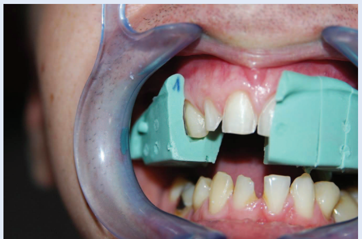
Slika 3. Kontrola preparacije pomoću silikonskog ključa