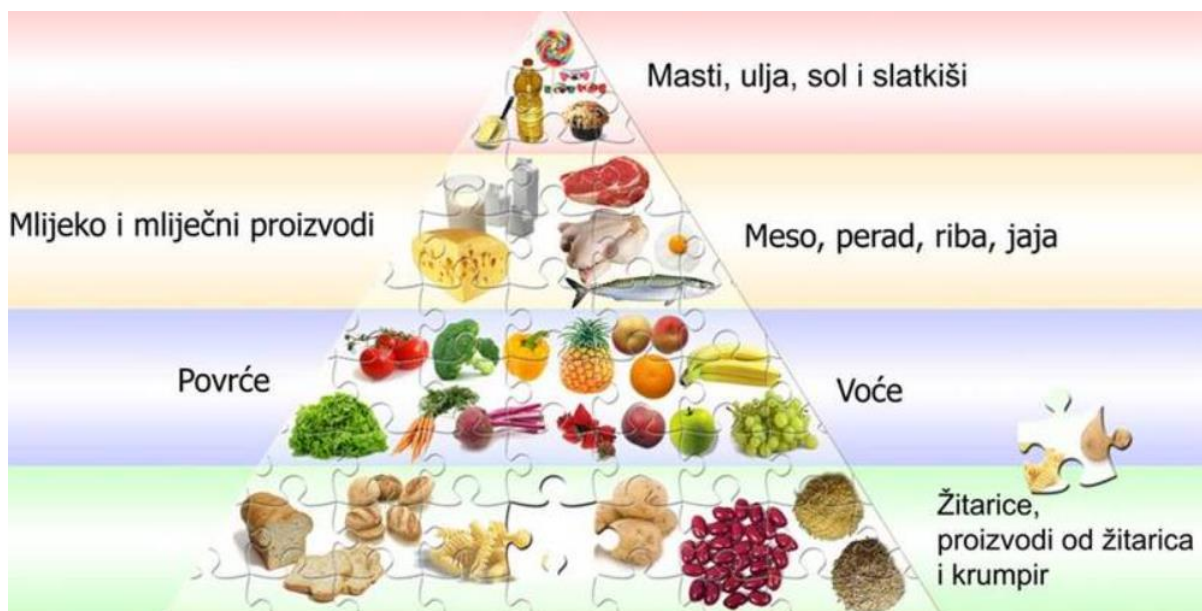
Slika 1. Hrvatska prehrambena piramida. (Ministarstvo zdravstva u suradnji s Ministarstvom obrazovanja, Hrvatskim zavodom za javno zdravstvo i kliničkim bolnicama, 2002.)

Često se za prikaz pravilne prehrane koristi takozvana piramida pravilne prehrane koja zorno prikazuje važnost pojedinih namirnica u svakodnevnoj prehrani. Sastoji se od 4 skupine namirnica podijeljenih u 4 razine. Na dnu piramide, ali od najveće važnosti nalaze se žitarice i proizvodi nastali iz njih koji čine temelj obrasca pravilne prehrane. Potom slijedi skupina voća i povrća koje je bitno kao izvor minerala i vitamina. Nakon navedenih skupina slijede bjelančevine odnosno proteini, a na samom vrhu što upućuje na njihovu minimalnu konzumaciju nalaze se masti i šećeri te visoko-prerađena hrana bogata njima (Slika 1).