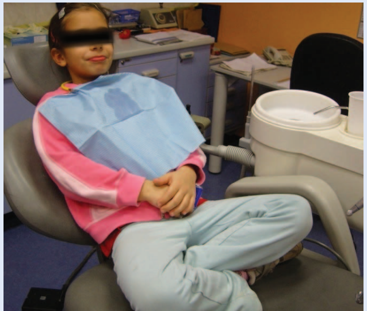
Slika 1. Kooperativno dijete koje je još uvijek na oprezu

Potencijalno nekooperativna djeca imaju izražen dentalni strah koji ih sprječava da surađuju s liječnikom tijekom zahvata. U skupini potencijalno nekooperativne djece razlikujemo nekoliko oblika ponašanja: nekontrolirano („histerično”), prkosno (tvrdooglavo), bojažljivo, napeto kooperativno, plačljivo i stoičko ponašanje 7 .