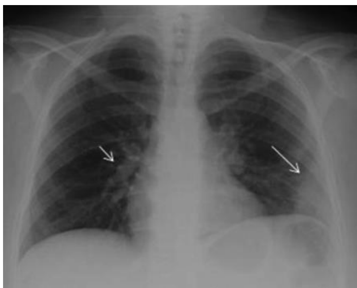
Slika 2. Radiogram pluća koji prikazuje trokutasto homogeno zasjenjenje lijevo- Hamptonov znak (duga strjelica) i proširenje desne silazne plućne arterije desno- Pallasov znak (kratka strjelica).

Radiogram pluća ne prikazuje specifične znakove za PTE, ali ima diferencijalno dijagnostički značaj za isključivanje drugih uzroka dispneje ili bolova u prsima. Neizravni znakovi koji mogu upućivati na PTE su nestanak plućnog crteža i atelektaza. Rjeđe se javljaju Hamptonov, Westemarkov ili Pallasov znak. Kod infarkta pluća nalazi se Hamptonov znak, trokutasto homogeno zasjenjenje s vrhom usmjerenim prema hilusu koji predstavlja nekrotično-hemoragično tkivo. Westemarkov znak označava fokalni gubitak vaskularne sjene, a Pallasov znak predstavlja proširenje hilusa ili desne donje plućne arterije.(1, 4, 6)