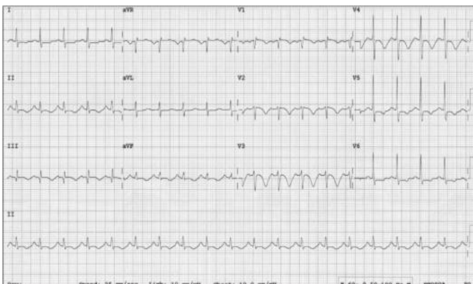
Slika 1. EKG – S1Q3T3 obrazac- plućna embolija. Slika preuzeta sa: Levis JT. ECG Diagnosis: Pulmonary Embolism. Perm J. [Internet] 2011Fall;15(4):75

EKG nalaz nedovoljno je specifičan za isključivanje ili postavljanje dijagnoze, ali ima prognostičku važnost jer korelira s težinom kliničke slike. U 40% bolesnika javlja se sinus tahikardija. U težim kliničkim oblicima na EKG-u mogu biti prisutni znakovi opterećenja desne klijetke- patološka desna električna os, blok desne grane, S1Q3T3 obrazac (duboki S-zubac u I. odvodu te patološki Q-zubac i negativan T-val u III. odvodu), inverzni T-val u desnim prekordijalnim (V1-4) i inferiornim (II, III, aVF) odvodima. S1Q3T3 obrazac prisutan je u 15- 25% bolesnika s PTE, ali i u drugim patološkim stanjima koja dovode do akutne dilatacije desne klijetke. (1, 4, 14)