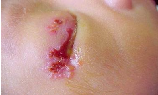
Slika 1.: Novorođenče s HSV infekcijom oka (8)

biti prisutne. HSV keratokonjunktivitis može progredirati u ožiljke na rožnici, kataraktu i korioretinitis koji mogu rezultirati i trajnim oštećenjima vida.