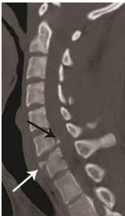
Slika 6. Sagitalni prikaz CT „teardrop“ frakture na prijelazu C5 i C6 (10)

Hiperekstenzija također može zahvatiti C1. Konkretno, kod hiperekstenzije dolazi do „otrgnuća“ (avulzije) prednjeg luka atlasa. Kako niti prednjeg atlantodentalnog ligamenta u ovoj frakturi ostaju očuvane, dolazi do poprečne frakture C1 koja je mehanički i neurološki stabilna.