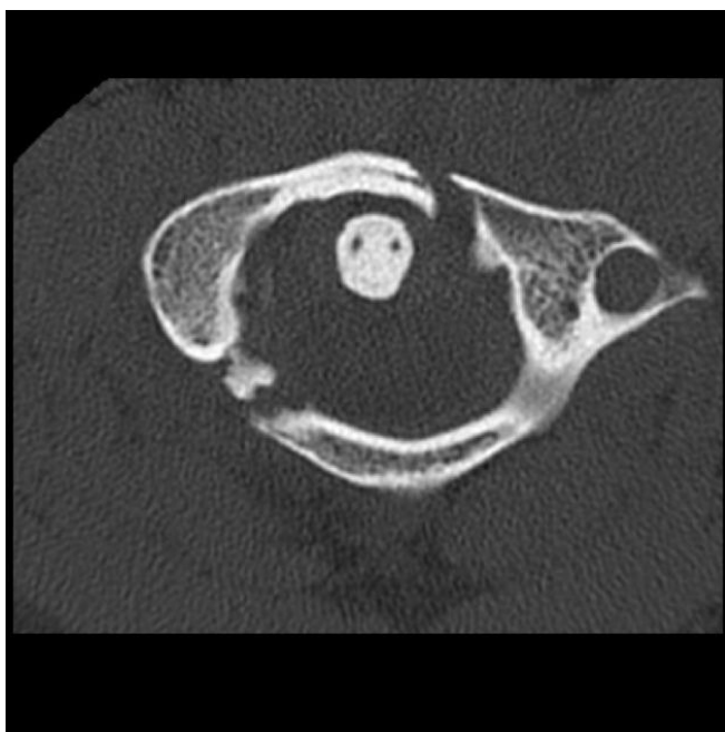
Slika 1. Aksijalni prikaz Jeffersonove frakture (4)

Frakture atlasa dijele se na frakturu prednjeg i stražnjeg luka te na tzv. Jeffersonovu frakturu. Jeffersonova fraktura je fraktura koja nastaje vertikalnim pritiskom na atlas, odnosno u praksi nastaje padom direktno na tjeme. Ovakav udarac uzrokuje lateralno “raspršivanje” komadića atlasa i zbog toga obično ne dolazi do oštećenja kralježnične moždine (slika 1). Jedina situacija u kojoj se očekuje ozljeda kralježnične moždine je kada je osim atlasa prekinut ili oštećen i prednji transverzalni ligament (4).