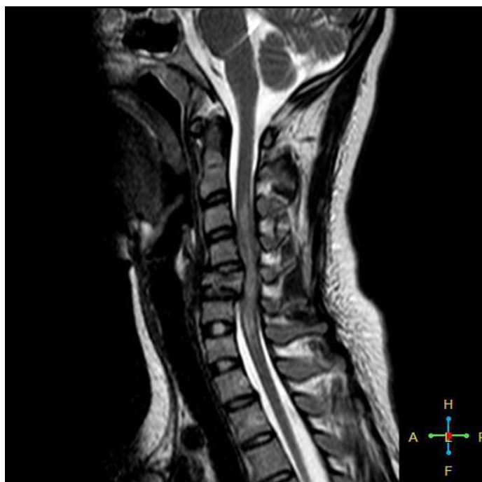
Slika 5. Sagitalni MR prikaz „teardrop“ frakture kralješka C5 (7)

Postoji oblik hiperfleksijske ozljede koja se zove „poput suze“, a nastaje kombinacijom fleksije i aksijalnog opterećenja. Najčešće je zahvaćen kralježak C5, a naziv je dobila po tome što anteroinferiorni dio kralješka bude otkinut u obliku trokuta (slika 5). Ovaj frakturirani trup kralješka često bude pomaknut posteriorno zbog čega ova fraktura može uzrokovati teško oštećenje medule (9).