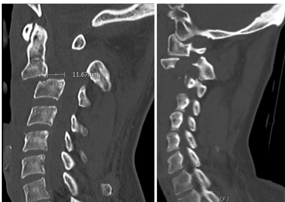
Slika 3: Sagitalni CT prikaz C2 spondilolisteze

Traumatska spondilolisteza kralješka C2 često je povezana s frakturom istog, a asocira se sa vješanjem kao oblikom suicida ili smrtne kazne. Zbog nagle hiperekstenzije vrata dolazi do bilateralne frakture pars interartikularisa C2 i njegovog pomaka prema naprijed. Također često dolazi do prolapsa diska C2-C3, no same posljedice na kralježničnu moždinu obično nisu velike zbog velikog promjera spinalnog kanala u ovom području (6) (slika 3).