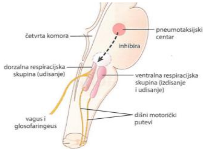
Slika 42-1. Ustrojstvo dišnog centra.