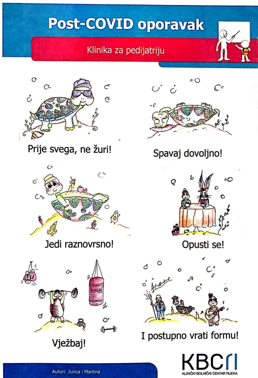
Slika 2. Shematski prikaz za post-COVID oporavak djece.