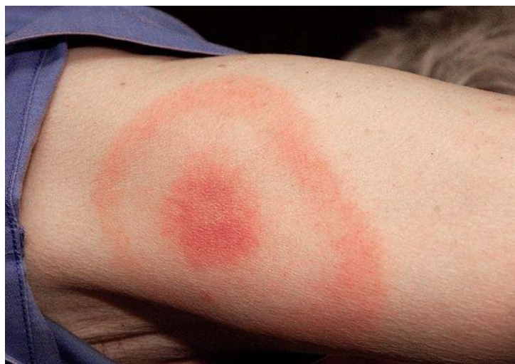
Slika 3. Erythema migrans (izvor: Begovac i sur 2019) (4)

Diferencijalna dijagnoza LB uključuje erythema necroticans migrans, granuloma annulare, mycosis fungoides, intersticijski granulomatozni dermatitis (IGD) te tinea corporis. Važno je ne zamijeniti nespecifičnu reakciju kože nakon ugriza nezaraženog krpelja. Naime, nakon ugriza nezaraženog krpelja na mjestu ugriza se obično pojavi crvenilo koje izbledi i nestane nakon nekoliko dana (22).