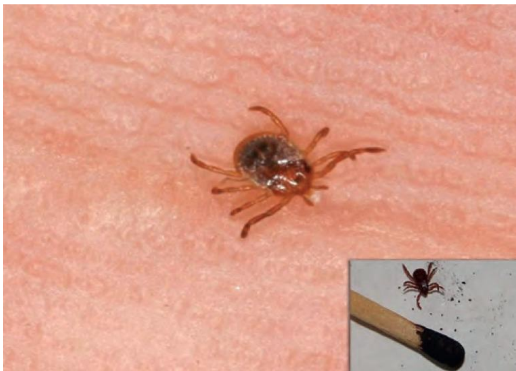
Slika 1. Prikaz krpelja iz kompleksa Ixodes ricinus na koži čovjeka