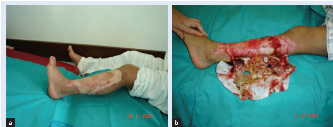
Slika 3. Opekline kože potkoljenice III° koja je karakterizirana nekrozom kože i potkožnog tkiva prikazana a) 4. i b) 12. dana tijekom konzervativnog liječenja Aquacel Ag oblogom.

kirurško uklanjanje nekrotičnog sloja, a nakon cijeljenja često ostaju hiperpigmentacije i ožiljci (slika 2).