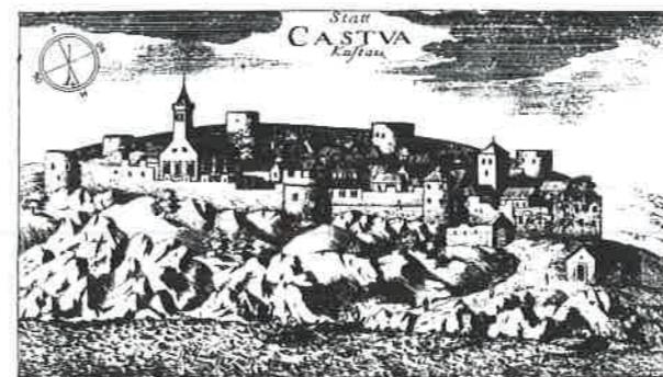
Slika 3. Kastav prema Valvasoru, 17. st.

Sastoji se od 57 »kapitula« bez određenog reda i raznog sadržaja nastalih 1400. ili 1409, dio u razdoblju od 1546. do 1614, a nekoliko odredbi još kasnije sredinom 17. stoljeća. Pisan je hrvatskim jezikom. Prepisi se čuvaju u Arhivu JAZU u Zagrebu i Arhivu Hrvatske, Isusovački kolegij Rijeka.