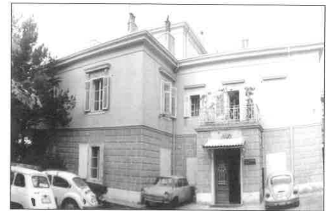
Slika 3. Stara zgrada Zavoda za radioterapiju i onkologiju KBC-a Rijeka 1963. godine.

Zbog potrebe širenja rada, u ožujku 1963. godine Odjel se premješta u zasebnu zgradu (vila Gorup ), gdje se dijelom i danas nalazi. Počinje raditi površinska rendgenska terapija, a s uvođenjem susjednog paviljona, Odjel ima 48 bolesničkih postelja (slika 3.).