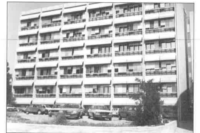
Slika 4. Na prvom katu Ginekologije smješten je 1985. novi dio Zavoda za radioterapiju i onkologiju KBC-a Rijeka.