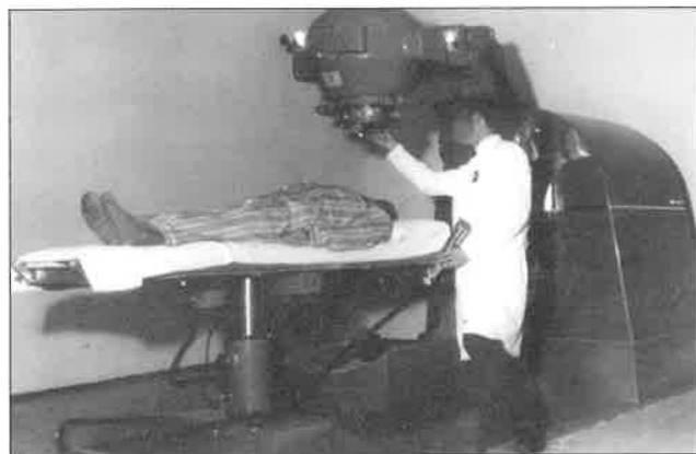
Slika 5. Kobaltna bomba (theratron B) u Rijeci u uporabi od 1965. do 2000. godine.

tar za ginekološki malignom u Petrovoj ulici u Zagrebu, jedini centar u kojem se ginekološki malignomi sustavno liječe i radijem 10 (slika 6).