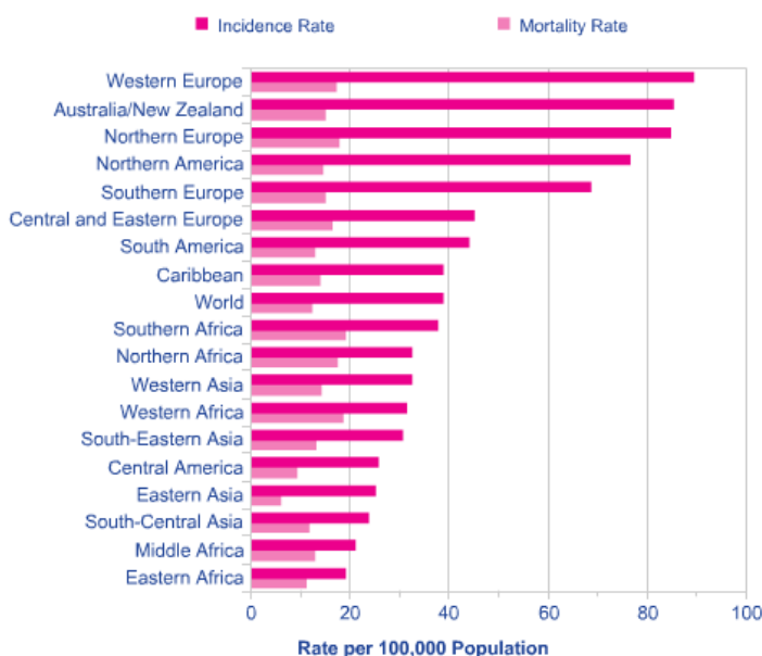
Slika 1. Incidencija i mortalitet raka dojke u svijetu

Rak dojke je najčešći zloćudni tumor u žena. Prema podacima iz Registra za rak iz 2012. godine u Hrvatskoj godišnje oboli oko 2500 žena što nas svrstava u zemlje s visokom incidencijom.