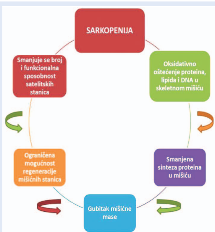
Slika 3. Sarkopenija je jedan od glavnih uzroka slabosti kod starije populacije