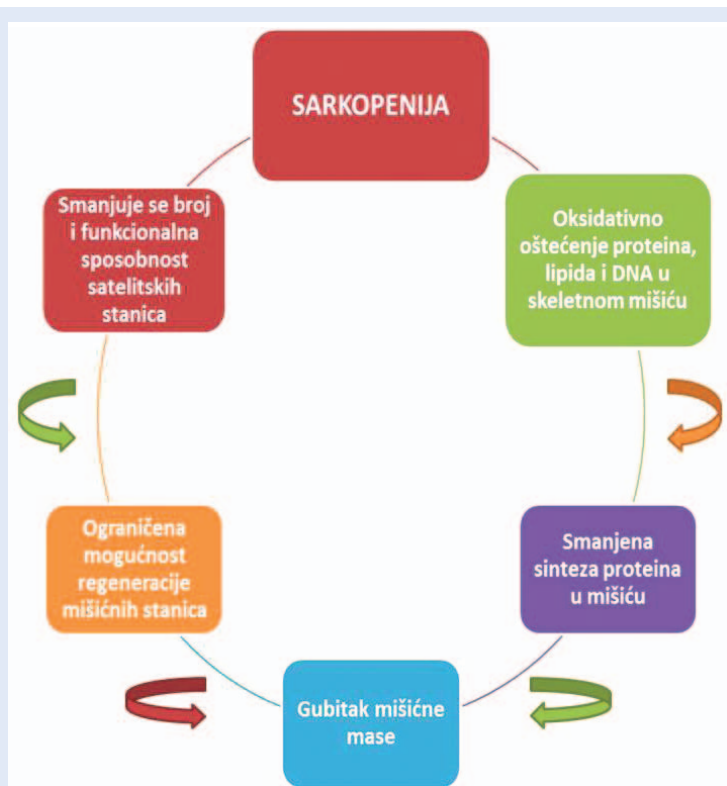
Slika 3. Sarkopenija je jedan od glavnih uzroka slabosti kod starije populacije