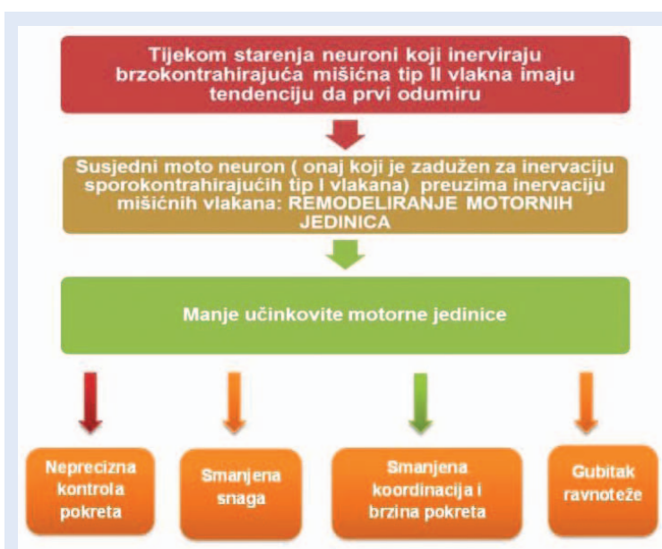
Slika 2. Remodeliranje motornih jedinica

Posljedica navedenog smanjenja mišićne mase je da mišići starijih osoba pokazuju smanjenje funkcionalnih sposobnosti kao što su snaga ili izdržljivost 15,34 . Postoje i dokazi da mišići ruku i nogu nisu ravnomjerno zahvaćeni. Gubitak mišićne snage u nogama je oko 40 % u odnosu na 30 % gubitka snage u mišićima ruku između 30. i 80. godine života 35 .