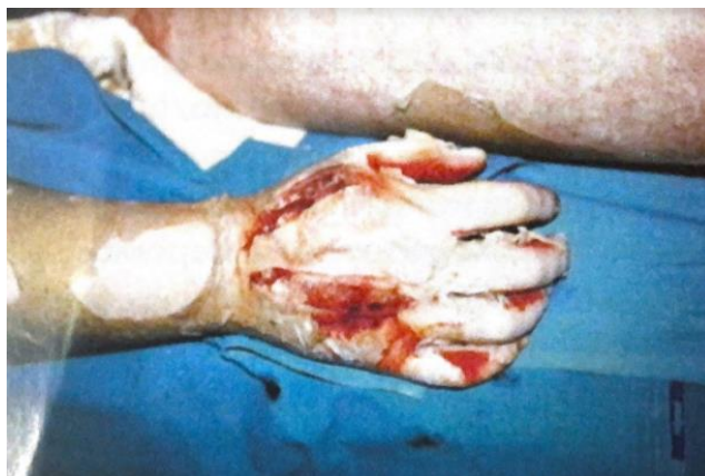
Slika 11. Dorzalna eskarotomija (4)

ekstremitet poslije navednog zahvata. Područja gdje se napravila eskarotomije kasnije se pokrivaju kožnim transplantatima, a kozmetički učinci nisu najbolji. Prsti zarastaju fiziološki uz blaga ograničenja funkcionalnosti. Obično u opeklina šake je zahvaćen dorzum, a kako bi se spriječio razvoj kontraktura, stavlja se posebna udlaga u karakterističan položaj. Na palmarnoj strani stoji udlaga, a šaka je u umjerenom fleksiji s abduciranim palcem. Ponekad kod dubokih i opsežnih opeklina ruku koriste se i Kirschnerove žice. Tim žicama se MCP zglob fiksira u fleksiji, a IP zglob u ekstenziji. Alenteza se izvadi kroz dva do tri tjedna, odnosno nakon što se završilo pokrivanje opeklina. (4)