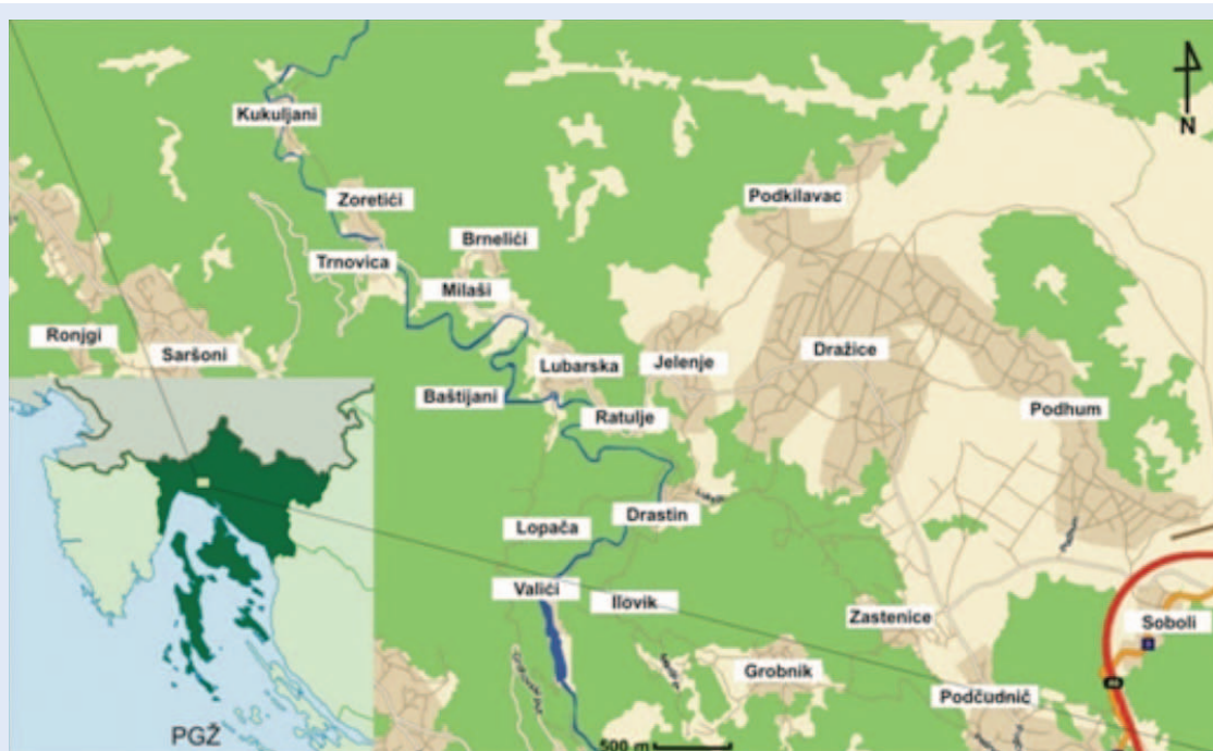
Slika 1. Karta područja Općine Jelenje

sle jedinke komaraca uzorkovane su u sumrak, kada je njihova aktivnost najveća. Ulovljene odrasle jedinke komaraca pohranjene su u za to predviđene plastične posude s naznačenim datumom i koordinatama mjesta ulova jedinke komaraca.