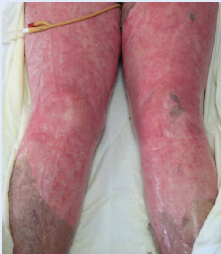
Slika 4. TEN: potpuno ogoljenje dermisa na velikoj površini kože

pacijentata. Određuje se kao i u slučaju opekline, pri čemu se u izračun ubraja samo nekrotična koža koja je već odljuštena (bule, erozije) i koža koja se može odljuštiti (Nikolsky-pozitivna područja), dok se Nikolsky-negativna eritematozna područja isključuju 3,4 . Prema površini zahvaćene kože pacijent se klasificira pod dijagnozu SJS-a (< 10 %), TEN-a (> 30 %) ili preklapanja SJS-a i TEN-a (10-30 %) 1,2 . Često se pripadnost određenoj skupini ne može sa sigurnošću odrediti odmah po nastupu bolesti pa se, ovisno o kliničkom tijeku, dijagnoza može i promijeniti tijekom prvih nekoliko dana. U svrhu procjene rizika i prognoze akut-