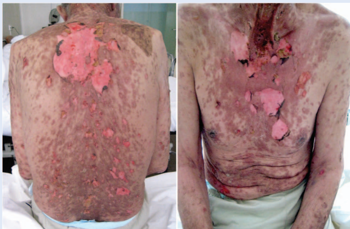
Slika 1. SJS/TEN – tipična distribucija i morfologija kožnih lezija