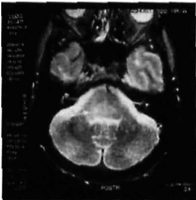
SLIKA 5. (SE TR 2500, TE 25/110, SE TR 500. TE 20, FE TR 500, TE 20, FA 20' Gd DTPA) Oštećenja u ponsu i produljenoj moždini bez promjena.

desnostrana je hemipareza izrazitija. Hoda uz pridržavanje, Započeta terapija interferonom beta (Betaferon "Schoering" ampa 0,25 mg, jedna ampula s. c. na dan svakoga drugoga dana). Nalaz MR-a živčane osi bez promjena u odnosu prema prethodnome (slika 5).