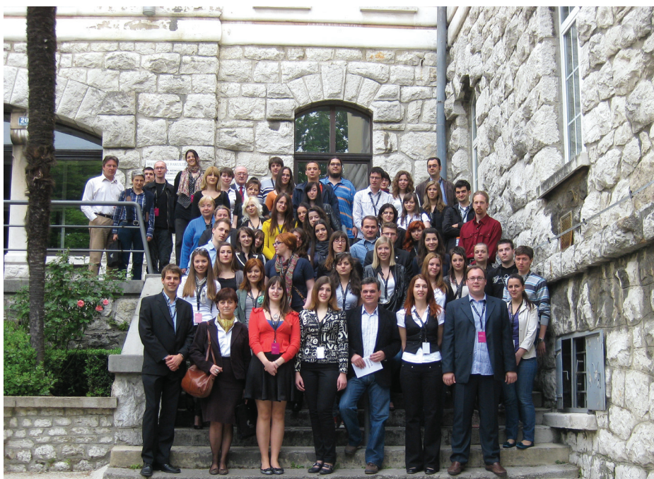
Sudionici 1. studentskog kongresa neuroznanosti – NEURI 2011; Rijeka

Participants of the 1 st Student Congress of Neuroscience – NEURI 2011; Rijeka