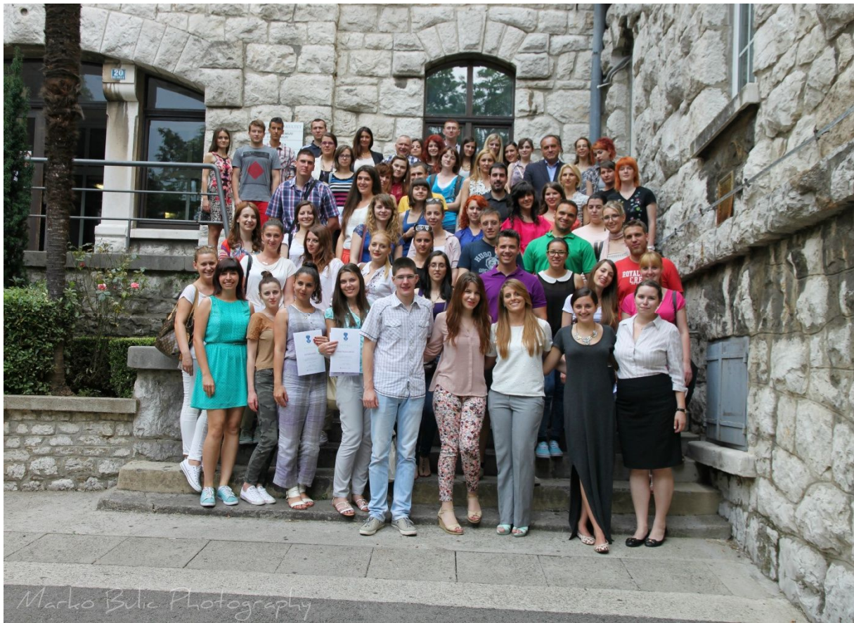
Organizacijski odbor kongresa 2014.godine