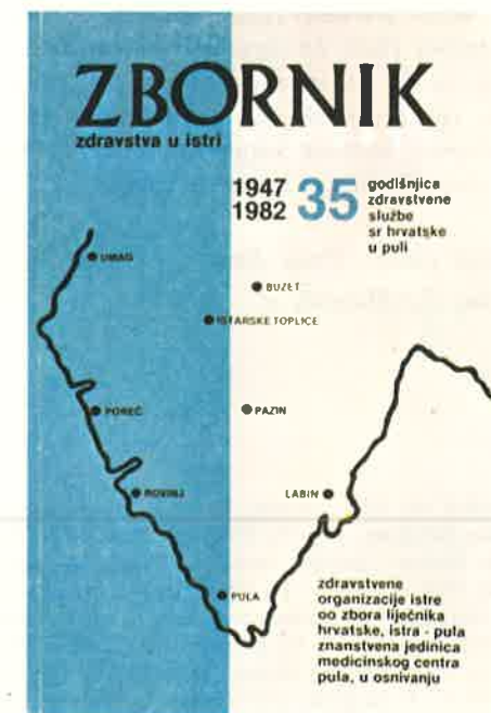
Slika 7. Naslovna strana četvrtog »Zbornika zdravstva u Istri« izdanog u povodu 35. obljetnice djelovanja zdravstvene službe SR Hrvatske u Puli

I Opća bolnica, i kasnije Medicinski centar prelazili su razne etape svog razvoja, bilježili su i uspone, ali ponekad i teške trenutke, no, razvojna se crta uvijek kretala prema gore (slika 6).