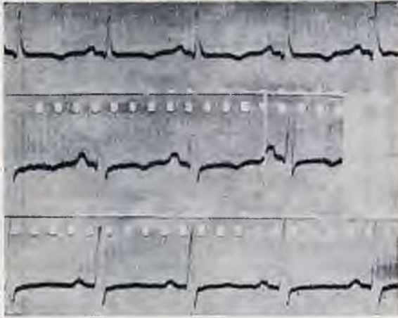
Sl. 2. 21. II. 53. Elevirana spojnica i negativni T valovi u I i II odv. ukazuju na pericarditis. Sinus ritam 100/min.

je potrebno i ostale elektrolite, proteine vitamine i t. d. Kod stanja koja su obično praćena sa hipokalijemijom (proljevi, postoperativna stanja i t. d.) treba paziti na prolazni porast kalija u serumu uslijed oslobađanja istog iz stanice u ekstracelularni prostor. Taj porast može biti i trajniji ako je bubreg lediran. Stoga treba počekati sa terapijom korekcije. Tako na pr. kod diabetične acidoze Sprague preporuča ne započinjati davanjem kalija prije tri do četiri sata nakon početka suzbijanja acidoze uobičajenom terapijom (2). Terapiju korekcije treba provoditi uz stalno kemijsko i elektrokardiografsko testiranje kalija u serumu.