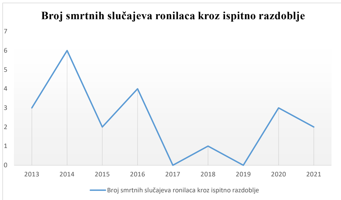
Graf 3. Distribucija ronilačkih smrti po godinama

U ispitivanom razdoblju, godina s najviše smrtnih slučajeva bila je 2014. godina (šest). Žrtve su pretežito bile srednje dobne skupine jer je većina njih imala između 40 i 61 godinu. Prosječna dob žrtava bila je 45 godina (raspon od 16 do 66 godina). Uspoređujući dob ronilaca i vrstu ronjenja, vidljivo je da je pet najmlađih žrtava ronilo na dah (Slučajevi 3., 9., 10., 17., 18.) Nažalost, ronjenje je skup sport i zahtjeva financijske izdatke ukoliko se želi iznajmiti ili kupiti oprema te nije neobično da se za amatersko ronjenje na dah češće odlučuje mlađa populacija koja je potencijalno slabijih materijalnih mogućnosti, što dokazuju gornji slučajevi. Kod 11 stradalih ( 11/21 = 52\% ) obdukcijom su utvrđeni prethodni komorbiditeti koji su pretežno zahvaćali kardiovaskularni sustav (Slučajevi 5, 7, 11, 12, 13, 14, 15, 16, 19 i 20), endokrini sustav (Slučajevi 12, 14 i 19), neurološki sustav (Slučaj 18) te je kod dviju žrtava bila od ranije poznata bolest „Button osteom“ u slučaju broj 20. te proširena maligna bolest u slučaju broj 15. Kod ostalih 10 žrtava ( 10/21 = 52\% ) nisu anamnestički navedeni prethodni komorbiditeti, niti su pronađeni medicinski dokazi prethodne bolesti te se smatra da su ti pojedinci bili dobrog