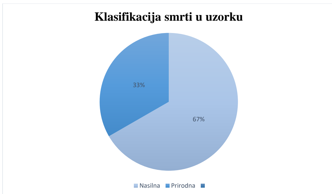
Graf 1. Klasifikacija smrti po načinu

U istraživanom uzorku, nakon obdukcijskog pregleda, smrti su podijeljene po načinu nastanka na nasilnu (14/21 = 67 %) i prirodnu (7/21 = 33 %). (Graf 1.)