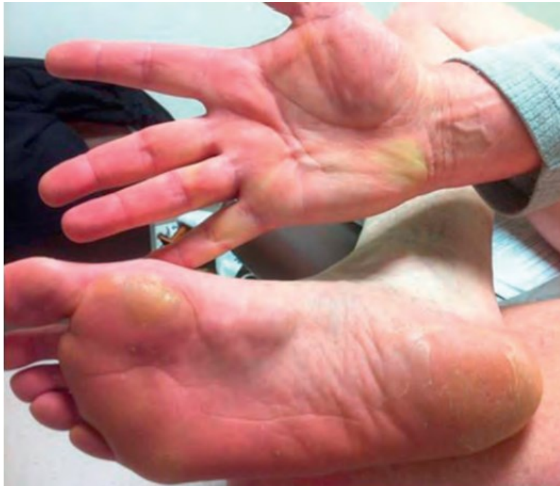
Slika 2: pacijent sa znakovima Dupuytrenove kontrakture, Ledderhoseove bolesti i Peyronieue bolesti (preuzeto iz Wein, A. J., In Kavoussi, L. R., Campbell, M. F., & Walsh, P. C. Campbell-Walsh urology. Philadelphia: Elsevier Saunders, 2016.)

raspodjelom sile u TA, palmarnoj fasciji i plantarnoj aponeurozi stopala. Te bolesti su usko povezane i tome u prilog idu podaci o prevalenciji Ledderhoseove bolesti u pacijenata s Dupuytrenovom kontrakturom od 22% te prevalenciji PB u pacijenata s Dupuytrenovom kontrakturom od 8,8% (10).