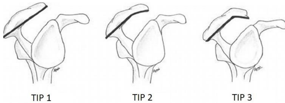
Slika 1. Morfologija akromiona