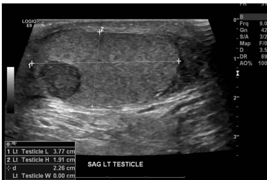
Slika 1. Tumor testisa na ultrazvučnom prikazu (preuzeto s:

Kao prva, a ujedno i jedna od najjeftinijih slikovnih metoda, nameće se ultrazvuk. Ultrazvuk skrotuma poželjna je početna slikovna metoda za procjenu mase u/na testisu. Ultrazvuk omogućuje potvrdu prisutnosti mase unutar skrotuma, određivanje unutar- ili vantagestikularne lokacije te pregled drugog testisa (Slika 1). Zbog jednostavnosti korištenja i niske cijene potrebno ga je učiniti i kod mlađih ljudi koji nemaju palpabilnu skrotalnu masu, ali imaju povišene vrijednosti serumskih markera te retroperitonealne i visceralne metastaze. Ultrazvuk ima osjetljivost od 92% do 98% te specifičnost od 95% do 99,8%. Magnetska rezonancija skrotuma ima 100%-tnu senzitivnost te specifičnost od 95% do 100%. Cijena magnetske rezonancije u većini slučajeva opravdava korištenje zbog prednosti u specifičnosti, međutim, ne koristi se u rutinskoj dijagnostici. MR nudi veliku pomoć u razlikovanju seminoma od neseminomskih tumora. Uz ultrazvuk i magnetsku rezonancu nužno je učiniti i CT zdjelice, abdomena i toraksa kako bi se utvrdila proširenost bolesti i postojanje udaljenih metastaza(7,13).