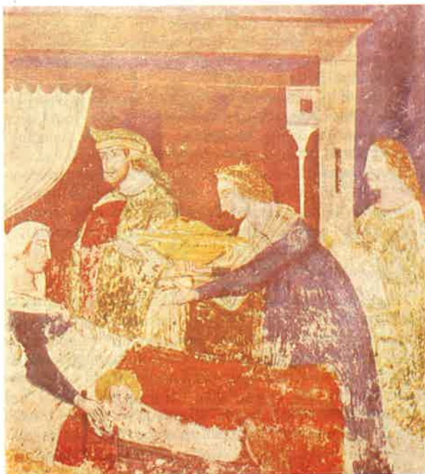
Slika 2 Rođenje sv. Nikole, 14. st., Rakoto, Crkva sv. Nikole