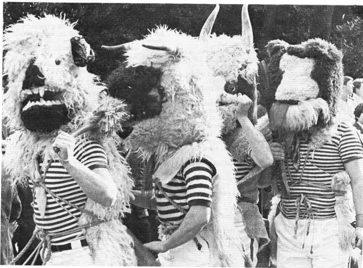
Slika 8. Halubajski zvončari – nekad zaštitnici od zlih duhova, danas etnografska reminiscencija

nje za bolest« i sl. 3 To izvode razni štrologi (čarobnjaci) i »babe zaklinjače«. Oni svojim molitvama i obredima nastoje udobrovoljiti zle sile koje su izazvale bolest, ili pozivaju upomoć dobre sile. Personifikacije zlih su štrige, štrigoni i fudlaki (zle žene i zli muškarci koji od rođenja nanose zlo); posebno opasni su fudlaki (vukodlaci) koji se noću pretvaraju u crnoga psa. Mora je djevojka koja noću siše krv mladem svijetu na prsima, a djeci na peti. Zaštita je mali kamen probušen u sredini što se nosi obješen o vrat. Ponekad djetetu zavežu krpicu s kokošjim izmetom oko pete, a ima i drugih metoda »zaštite«. 8 Za razliku od fudlaka, vile ili božje žene rade dobra djela. Djeci je posebno drag Malik. Tako se zove »aš je kot jedan mali od pet-šest let«. Na glavi nosi crvenu kapicu, a djeca mu pjevaju prigodne pjesmice jer vjeruju da Malik čuva zakopane novce, i da bi im mogao pomoći u nevolji. 9