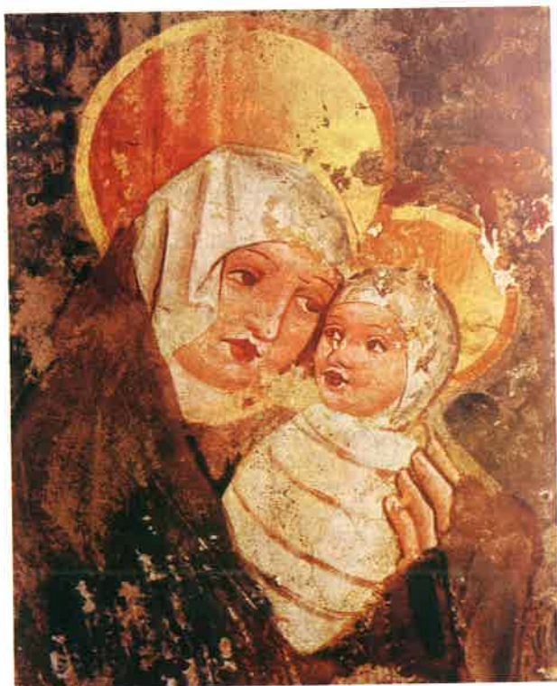
Slika 4 Bogorodica s djetetom, približno 1471. Žminj, Crkva sv. Trojstva.