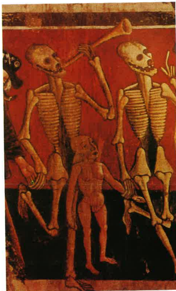
Slika 6 Vincent iz Kastva, 1474. Ples mrtvaca, detalj s djetetom. Beram, Crkva sv. Marije na Škrilinah.