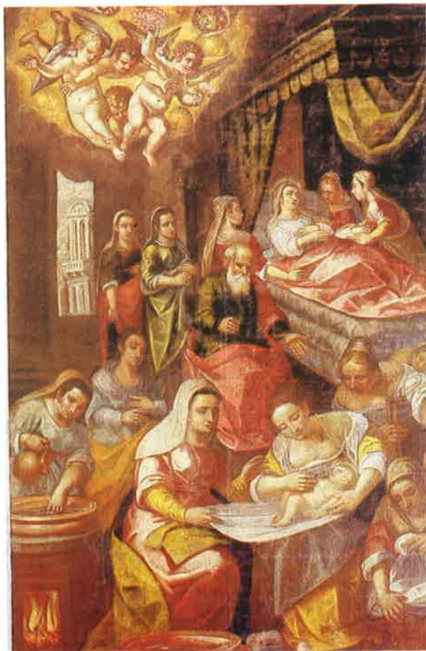
Slika 3 Moreschi, 17. st., Rođenje Bogorodice, detalj, kupanje, topla voda, čiste pelene. Kapela sv. Marije od Karmele, Labin.

Groznica je bolest što se najčešće javlja uz more, na močvarnim mjestima iz kojih, prema vjerovanju naroda, zbog vrućine izlaze otrovne pare i truju čovječju krv. Čovjek koji dobije groznicu izgubi tek, ne može spavati, šumi mu u ušima, kaže se da u tijelu ima mrzlicu od koje nastaje velika vrućina, pa velika ognjica, potom tijelo mu