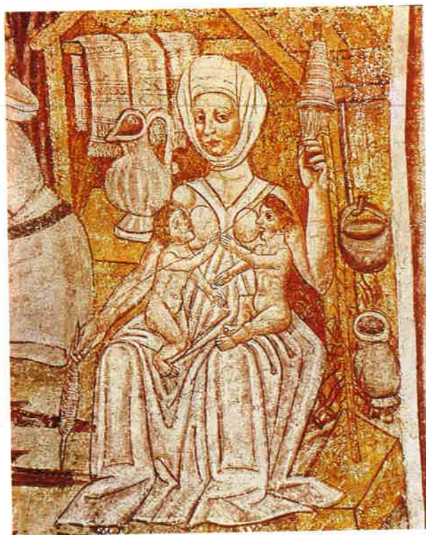
Slika 5 Ivan iz Kastva i suradnici, približno 1490. Eva, detalj.