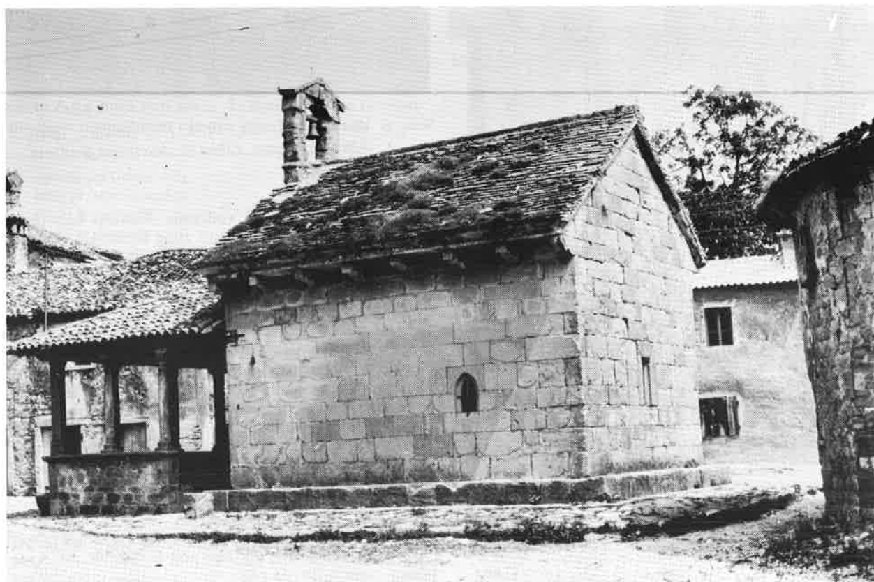
Slika 7 Crkva sv. Marije u Gračišću u čije su sljubnice među kamenim blokovima nerotkinje zabijale zavjetne čavle

Nasuprot empirijskom liječenju, tradicionalno je prisutno magijsko liječenje, i to čaranje, vraćanje, »razgovara-