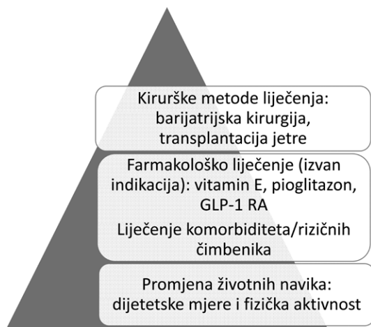
Slika 4. Promjene životnih navika i životnog stila čine temelj liječenja bolesnika s nealkoholnom bolešću masne jetre, dok su farmakološka terapija i kirurške metode indicirane kod manjeg dijela oboljelih.

Među najčešće ispitivanima su lijekovi koji povećavaju osjetljivost na inzulin. Primjena metformina u liječenju šećerne bolesti je uz regulaciju glikemije povezana sa smanjenjem inzulinske rezistencije i razine jetrenih enzima, ali, nažalost, nije dovela do histoloških promjena u bolesnika s NAFLD-om i stoga nije indiciran za liječenje jetrenih promjena u NAFLD-u 1,7,94 .