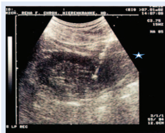
Slika 1. Ultrazvuk bubrega tijekom biopsije bubrega na kojem se vidi trag igle uvedene u parenhim (zvjezdica).