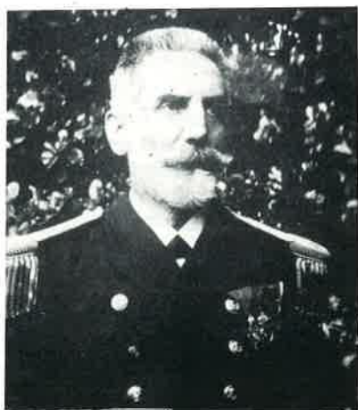
Slika 1 Prof. dr. Petar Salcher (1848—1928)

Krajem 19. stoljeća Rijeka doživljava svoj briljantni uspon. U zadnja dva desetljeća grad je procvao u otvoreno kozmopolitsko lučko središte, a gradonačelnik Ivan komendator Ciotta svojom administracijom 25 godina mudro upravlja gradom. Tih posljednjih dvadeset godina znače za Rijeku formiranje bolnice »Sv. Duha« u samostalnu modernu zdravstvenu ustanovu. Nadalje, u to vrijeme se uvodi kanalizacija, vodovod, elektrifikacija, otvara se kazalište, brojne škole, vrtići, osnivaju se gradske biblioteke i mnogobrojna društva. Među društvima posebno se isticao »Klub za prirodne znanosti«. U njemu su bili učlanjeni svi riječki liječnici, profesori fizike i biologije, mnogobrojna riječka inteligencija, te industrijalci, veletrgovci i posjednici.